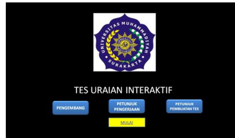
Gambar 1. Homeview merupakan tampilan utama ketika tes pertama kali dijalankan yang terdapat beberapa tombol menu pilihan.

Tampilan produk akhir dapat dilihat pada Gambar 1 hingga Gambar 4.