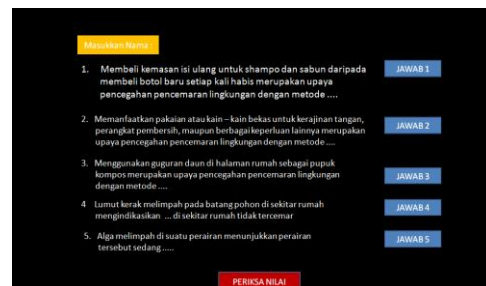
Gambar 2. Worksheet merupakan halaman kerja tes dimana terdapat tombol untuk menjawab soal