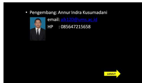
Gambar 4. DeveloperID merupakan informasi mengenai pengembang tes