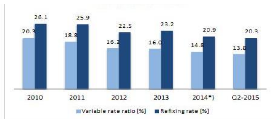
Gambar 5.3 Resiko Tingkat Bunga

Dalam setiap penerbitan Surat Berharga Negara (SBN) selalu dibarengi dengan pembayaran kembali berupa pembayaran pokok dan bunga, sebagai imbal hasil bagi investor. Pembayaran bunga Obligasi Negara tentu dapat menambah beban fiskal, terutama SBN yang memakai bunga mengambang (kupon mengambang), terlebih lagi ketika ada kenaikan suku bunga. Beban fiskal akibat pembayaran bunga SBN dapat dilihat dari meningkatnya resiko tingkat bunga, sebagaimana Gambar 5.3 berikut: