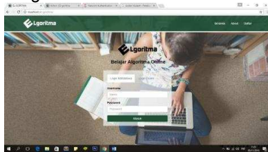
Gambar 4.1 Tampilan form login

Portal guru bersifat sebagai tim pengajar dimana akses yang di berikan berupa menginputkan materi, memberi kuis dan memberi pengumuman. Sedangkan portal siswa hanya sebatas mengakses dan menjawab.