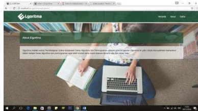
Gambar 4.2 Tampilan penjelasan algoritma