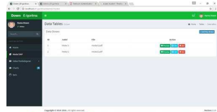
Gambar 4.6 Form ipload materi dosen

Dari gambar di atas terdapat sketsa kasar mengenai tampilan EL-Goritma. Adapun rancangan mengenai isi EL-Goritma adalah sebagai berikut: