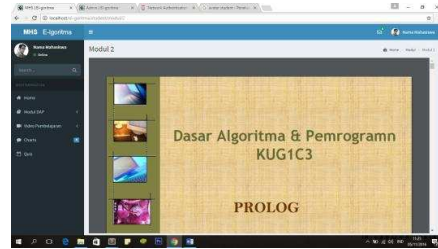
Gambar 4.5 Halaman student (materi)

Adapun dari beberapa tahapan yang telah pembuat kerjakan, di dapatlah gambaran awal yang bersifat tidak tetap dalam perancangan EL-Goritma. Tampilan sewaktu-waktu dapat berubah sesuai dengan kebutuhan.