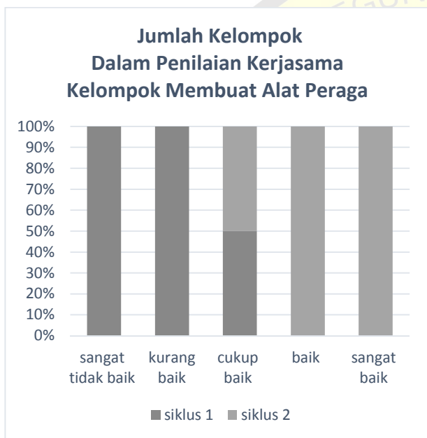
Gambar 2 Jumlah Kelompok Hasil Penilaian Kerjasama Membuat Alat Peraga Matematika