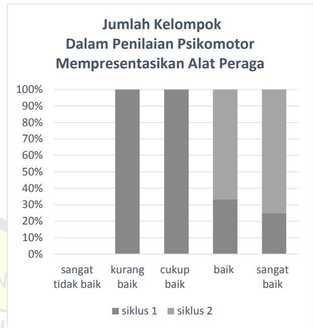
Gambar 3 Jumlah Kelompok Hasil Penilaian Psikomotor Mempresentasikan Alat Peraga Matematika