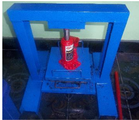
Gambar 1 gambar cetak briket

Pengujian yang dilakukan adalah uji nyala, uji pendididhan air dan uji kalor .Alat pengepresan briket adalah sebagai berikut :