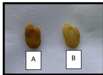
Gambar 2. Benih yang diskarifikasi terlebih dulu kemudian disterilkan (A) dan benih disterilkan lebih dulu kemudian diskarifikasi (B)

dilakukan setelah benih disterilkan. Berdasarkan pengamatan yang dilakukan secara visual, skarifikasi yang dilakukan sebelum sterilisasi dapat menyebabkan benih berubah warna menjadi kecoklatan dan pada akhirnya eksplan benih kayu kuku akan mati. Pada Gambar 2 disajikan perbedaan penampakan antara benih yang diskarifikasi sebelum disterilkan dengan benih yang disterilisasi lebih dulu kemudian dilakukan skarifikasi.