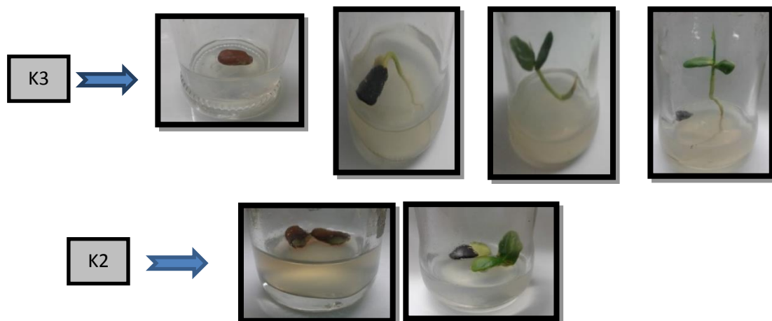
Gambar 3. Kondisi perkecambahan benih pada perlakuan diskarifikasi dengan cara dikupas pada sisi lainnya (K3) dan sisi keluarnya hipokotil (K2)

menunjukkan persentase benih yang berkecambah 100% tetapi yang menjadi kecambah sempurna hanya 40 %. Sebaliknya yang terjadi pada tanaman aren, metode skarifikasi tepat pada posisi embrio (deoperkolasi) dapat mematahkan dormansi, dengan nilai berkecambah \geq 80\% (Rofik dan Murniati, 2008). Dari hasil pengamatan secara visual, benih yang kotiledonnya terbuka lebih dulu dan menghiyau tanpa diikuti dengan pemanjangan hipokotil, maka benih pada umumnya tidak membentuk daun. Sebaliknya jika terjadi pemanjangan hipokotil lebih dulu kemudian diikuti dengan terbukanya kotiledon maka daun akan terbentuk. Kondisi perkecambahan benih disajikan pada Gambar 3.