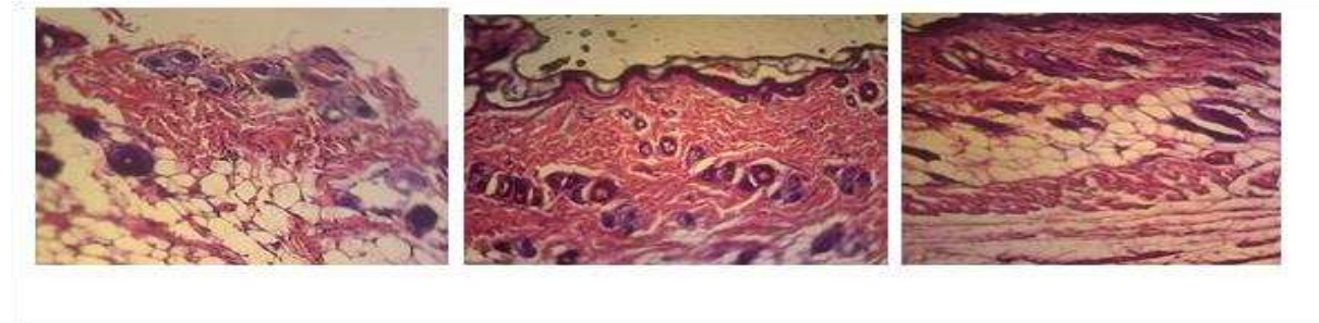
Gambar 2. Struktur Jaringan Mammae Tikus Putih, Pewarnaan HE, 100x (A) Kontrol; (B) Perlakuan larutan biji kacang gude 1:1; (C) Perlakuan larutan biji kacang gude 1:3 Jaringan lemak memadat, tidak ada proliferasi epitel lumen duktus (A); Duktus lobularis jaringan mammae P 2 mengalami proliferasi, sel epitel duktus berproliferasi dan pertambahan diameter lumen duktus dan beberapa lumen berisi cairan kelenjar, jaringan otot memadat (B); Duktus lobularis jaringan mammae P 3 mengalami