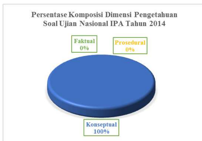
Gambar 1. Diagram Persentase Komposisi Dimensi Pengetahuan Soal Ujian Nasional IPA SMP Tahun 2014.

Nasional IPA SMP tahun 2014 dapat disajikan dalam diagram berikut: