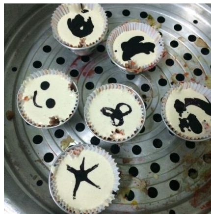
Gambar 2. Pengukusan Bolu Kukus