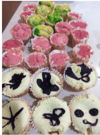
Gambar 3. Hasil Bolu Kukus dari Percobaan 1 sampai Percobaan 4

Memasukkan data tersebut ke dalam tabel faktor utama untuk mengetahui percobaan yang menghasilkan bolu kukus yang paling mengembang atau dengan ketinggian yang maksimal dengan ketentuan level berdasarkan tabel orthogonal array. Berikut data hasil yang diperoleh.