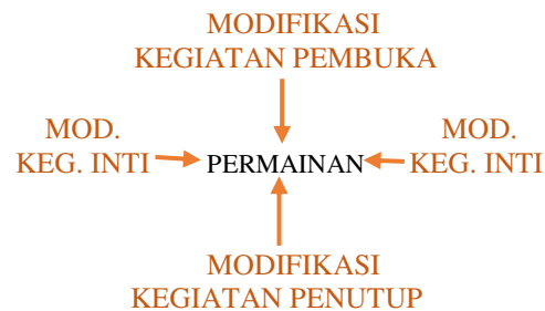
Gambar 2. Modifikasi Kegiatan Inti III. Peta Implementasi Pengembangan Model