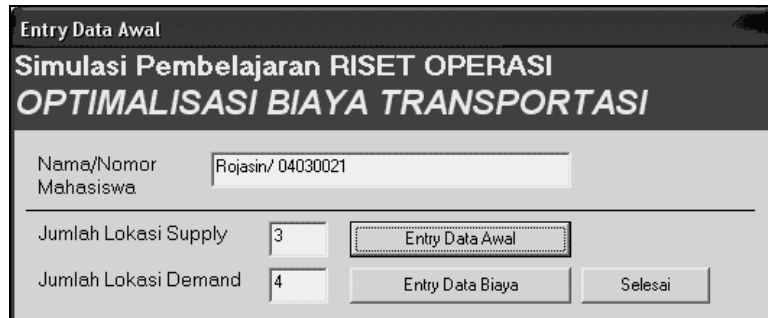
Gambar 4. Form Pengisian Data Awal

Sarana pengisian data awal merupakan bagian yang pertama kali tampil ketika aplikasi dijalankan. Seperti yang telah dirancang pada bagian perancangan sistem, form entry data awal meminta input nama dan nomor mahasiswa, serta jumlah lokasi supply dan demand yang diinginkan.