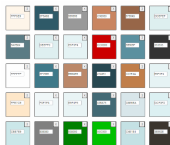
Gambar 6. Hasil ekstrak warna www.ntu.edu.tw

National Taiwan University yang memiliki motto “Pelihara Moral, Majukan Kecerdasan; Cintai Negerimu, Cintai Rakyatmu”, alamat website http://www.ntu.edu.tw , setelah proses ekstrak warna didapatkan warna dengan background putih dan dengan 30 kombinasi seperti gambar berikut: