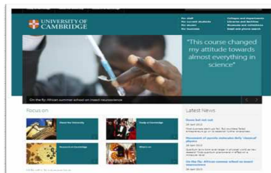
Gambar 4. Website University Of Cambridge

Warna yang dominan pada website tersebut adalah #2E3756 (biru gelap), #585858 (hitam) dan warna background #FFFFFF (putih). Motto Veritas (Latin untuk "kebenaran") diwakilkan dengan warna biru yang berarti kekuatan, kepercayaan, hitam bermakna kokoh, kuat dan warna putih bermakna disiplin, kekuatan. Sedangkan dalam aspek usability warna biru menjadi spot color yang fungsinya menjadi point of interest dari keseluruhan materi yang disampaikan. Warna hitam (5%) digunakan pada Header, Footer dan beberapa teks sebagai penegas disamping untuk memberi kesan elegan dan simple. warna Putih menjadi dominasi (85 %) dari keseluruhan desain website ini berfungsi sebagai warna background dan warna dominan, pemilihan warna putih dimaksudkan untuk mencapai tingkat informasi yang tinggi atau mudah terbaca oleh user atau pengguna.