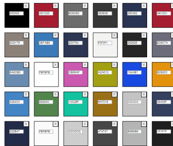
Gambar 3. Hasil ekstrak warna www.harvard.edu

Harvard University yang memiliki motto Veritas (Latin untuk "kebenaran"), alamat website www.harvard.edu , setelah proses ekstrak warna didapatkan warna dengan background putih dan dengan 30 kombinasi seperti gambar berikut: