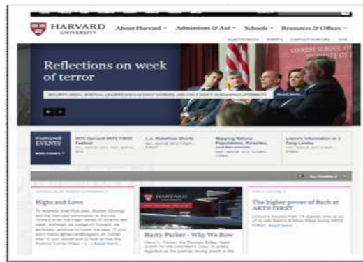
Gambar 2. Website Harvard University

Harvard University yang memiliki motto Veritas (Latin untuk "kebenaran"), alamat website www.harvard.edu , setelah proses ekstrak warna didapatkan warna dengan background putih dan dengan 30 kombinasi seperti gambar berikut: