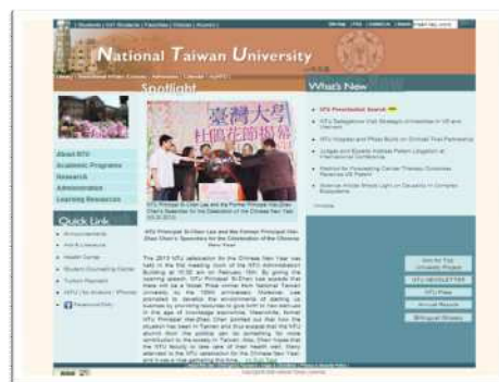
Gambar 5. Website National Taiwan University

University Of Cambridge yang memiliki motto Hinc lucem et pocula sacra “Dari universitas ini kami menerima pencerahan dan pengetahuan yang berharga”. alamat website http://www.cam.ac.uk . Pada penelitian ini melakukan beberapa kali ekstrak warna web University Of Cambridge menggunakan Color Scheme Extraction Tool yang disediakan oleh www.colorcombos.com namun kami mengalami kegagalan, sehingga kami menggunakan bantuan color selector pada Adobe Dreamweaver CS.5 dan kami memperoleh warna #106470 (hijau toska) sekitar 40% , #ffffff ( putih) 50%, #171717(hitam) 10%. Motto “Dari universitas ini kami menerima pencerahan dan pengetahuan yang berharga” diwakili oleh warna hijau melambangkan Bersemangat, ketulusan, pembaruan, kelimpahan, keseimbangan, harmoni, warna hitam melambangkan kokoh, modern, kecanggihan, dan warna background putih melambangkan disiplin, Kekuatan, kemurnian. Sedangkan untuk aspek usability Warna hijau toska yang teduh mengacu pada karakter ramah lingkungan dan back to nature. Sedangkan selain memiliki karakteristik netral, warna putih dipilih pada komposisi desain, dimaksudkan untuk meningkatkan keterbacaan informasi yang tersedia. Warna hitam yang memiliki karakter tegas, elegan dan kecanggihan di gunakan pada header dan footer. Komposisi warna yang diterapkan pada layout juga memberi kemudahan akses informasi pada pengguna. Seperti warna biru sebagai warna yang spot yang digunakan sebagai point of view dari keseluruhan materi yang tersedia.