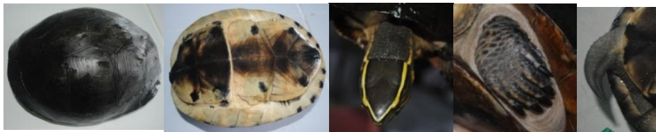
Gambar 1. Morfologi Cuora amboinensis : karapas (a), plastron (b), kepala (c) tungkai (d) dan ekor (e)

Kepala Cuora amboinensis berwarna hitam dengan garis kuning melingkar mengikuti tepi kepala bagian atas dan bagian pipi. Bibir berwarna kuning, dan mata mempunyai iris berwarna kuning (Gambar 1c). Tungkai Cuora amboinensis memiliki pola khas berupa garis berwarna kuning pada jari-jarinya (Gambar 1d). Berdasarkan bentuk ekor yang panjang dan langsing, tiga individu Cuora amboinensis yang ditemukan pada penelitian semuanya jantan (Gambar 1e).