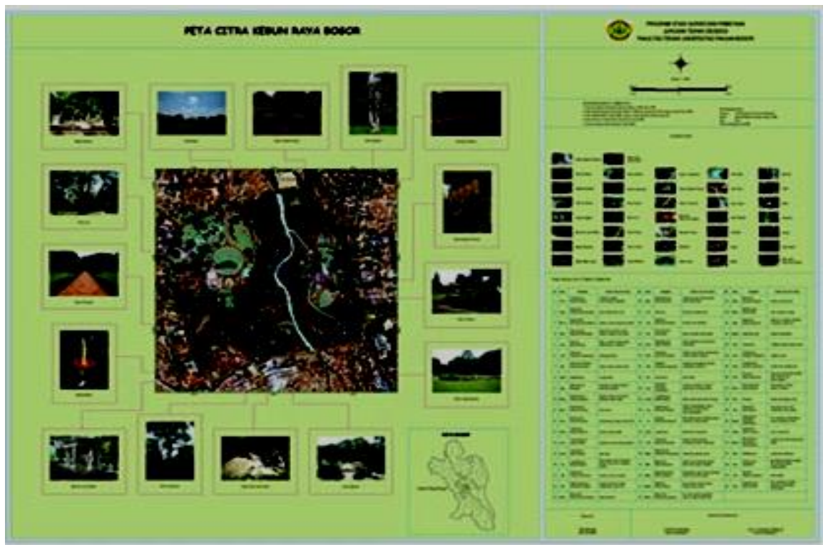
Gambar 2 Hasil Akhir Visualisasi Peta Citra Kebun Raya Bogor Skala 1:5.000, dalam Bentuk Cetak Berukuran A0, dengan Tabel Besar di Bagian Kanan Bawah Adalah Tabel Jenis Tumbuh-Tumbuhan Beserta Suku-Sukunya.

Gambar 3 berikut adalah crop dari muka peta citra tersebut, untuk mendapatkan kenampakan yang lebih jelas tentang visualisasi tumbuh-tumbuhannya. Unsur tumbuh-tumbuhan tampak jelas pada muka peta disertai notasi nama-namanya yang dipilih dengan huruf berwarna kuning.