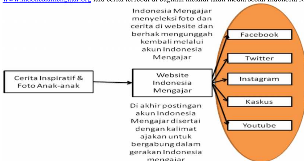
Gambar jalur umum dalam penggunaan media sosial Indonesia Mengajar

Sedangkan jalur umum setiap Pengajar Muda diwajibkan menulis cerita inspiratif tentang perjalanan selama satu tahun dipenempatan, cerita ini biasanya berisi tentang cerita anak-anak, guru, penggerak dan masyarakat yang ditemui oleh pengajar muda. Cerita yang disertai foto itu di unggah ke dalam website www.indonesiamengajar.org lalu cerita tersebut di bagikan melalui akun media sosial Indonesia Mengajar.