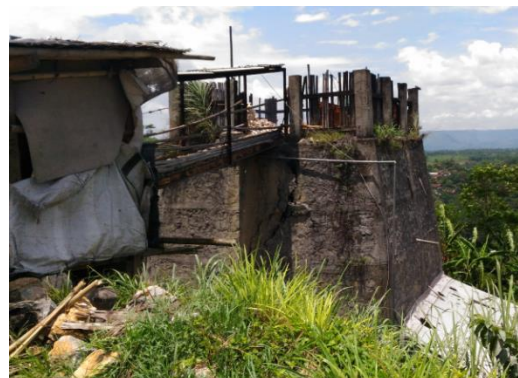
Gambar 2. Tobong Pembakaran Batu Kapur di Sukabumi

komposisi air dan proses aerasi gas karbon dioksida. Pusat Penelitian Metalurgi dan Material LIPI telah berhasil membuat kalsium karbonat presipitat dari batu kapur skala laboratorium, pengembangan skala pilot dan semi pilot di Pusat Penelitian Mineral dan Batubara (Tekmira) dan industri pembuatan kalsium karbonat presipitat telah berdiri di Daerah Istimewa Yogyakarta yaitu P.T. Selodwipo dan di Gresik oleh P.T. Omica Indonesia. Kalsium karbonat presipitat juga telah diaplikasikan dengan karet alam membentuk komposit baru yang digunakan untuk aplikasi jembatan telah dilakukan di Pusat Penelitian Karet di Bogor. [8] Perkembangan riset terakhir pembuatan kalsium karbonat presipitat adalah pembuatan kalsium karbonat presipitat ukuran nano untuk bahan filler pada beragam material polimer, karet dan lain-lain, kemudian untuk keperluan tinta printer dan bahan imbuhan pada pembuatan tulang buatan (biokompatibel). Hingga saat ini kalsium karbonat yang dihasilkan di sekitar DAS Cilandar adalah untuk bahan bangunan yaitu bahan baku semen dan dibakar dalam tolong untuk dijual sebagai kalsium hidroksida/ kapur padam dan kalsin batu kapur.