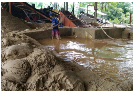
Gambar 3. Proses Pencucian Pasir Kuarsa di Sukabumi

Pasir Kuarsa dari DAS Cimandiri yang berada di Kecamatan Cisaat dan Cibadak dapat dimanfaatkan untuk bahan baku panel surya dengan syarat sumberdaya pasir kuarsa tersebut dihilangkan kadar pengotornya. Dari hasil pencucian yang telah dilakukan telah diperoleh peningkatan kadar \text{SiO}_2 dari 93% menjadi 95% untuk pencucian dengan air dan meningkat menjadi 97 % \text{SiO}_2 dengan pencucian asam khlorida encer dan dengan proses sonifikasi diperoleh peningkatan kadar menjadi 99,46 %. [9] Pasir kuarsa yang telah dicuci tersebut jika diproses dalam berbagai tahapan proses yang rumit dapat diperoleh panel surya untuk menghasilkan listrik dari tenaga matahari. Pada saat ini penambangan pasir kuarsa di DAS Cimandiri dilakukan secara sederhana dengan menggali bukit untuk diambil pasir kuarsa, pasir kuarsa tersebut dicuci dengan menggunakan air bersih. Hasil yang diperoleh adalah pasir kuarsa yang masih kotor dengan kadar maksimal 95 % dengan warna kecoklatan. Pasir kuarsa tersebut selanjutnya digunakan sebagai bahan baku bata ringan dan bahan bangunan lainnya.