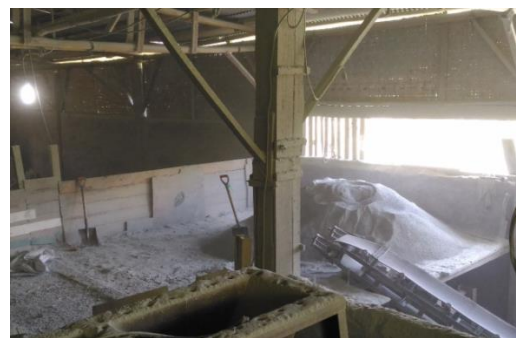
Gambar 4. Pembuatan Serbuk Zeolit di Sukabumi

Zeolit dari Kabupaten Sukabumi hingga saat ini hanya digunakan sebagai bahan pembuatan keramik hias warna hijau untuk ornament rumah. Sisa berupa potongan digerus sampai halus dengan ukuran kurang lebih 100 mesh, selanjutnya dijual murah ke tempat penampungan serbuk zeolit.