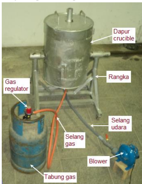
Gambar 2. Dapur crucible hasil rancangan

Perancangan, pembuatan dan pengujian dapur peleburan logam non-ferro pada penelitian ini telah dilakukan. Berdasar pada tahapan penelitian, dapur crucible hasil rancangan dapat dilihat pada Gambar 2.