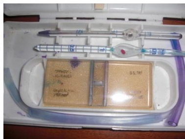
Gambar 1. Alat Hemositometer

Pengambilan darah dalam perhitungan trombosit dilakukan melalui ekor M. musculus , penghitungan trombosit dilakukan dengan alat hemositometer (Gandasoebrata, 1984).