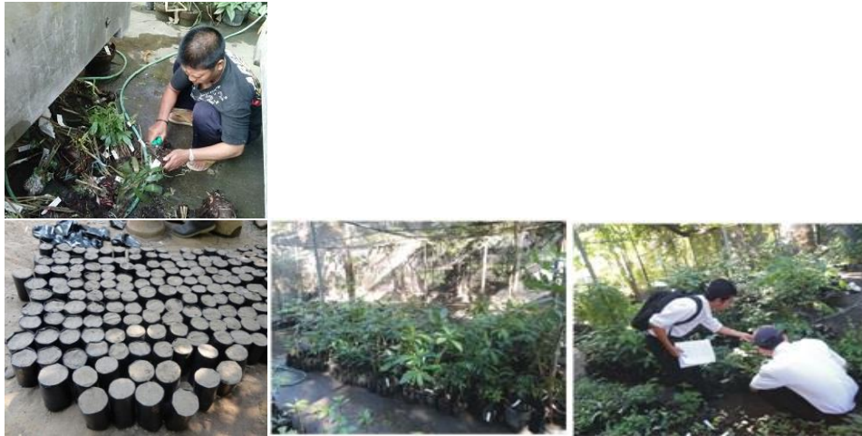
Gambar 2. Tahapan Aklimatisasi di Unit Seleksi dan Pembibitan: 1) cek label dan penanganan material. 2) penyungkupam tumbuhan hasil eksplorasi pada bak pasir, 3) pembukaan sungkup, 4). pemindahan tanaman pada polibag, 5) pemeliharaan sementara, 6) monitoring

2010). Bak semai tersebut selanjutnya disungkup dengan plastik dengan tujuan agar kondisi kelembapan pada media dan tumbuhan tetap terjaga (Gambar 2.2). Setelah 2 minggu tanaman rata-rata mulai betunas dan cukup kuat untuk disiram dengan air hal ini dilakukan agar tanaman terjaga kesehariannya. Frekuensi penyiraman berpengaruh terhadap pertumbuhan tanaman (Djajadi dkk, 2010), setelah hampir satu bulan sungkup plastik mulai dilepas. Tanaman akan semakin membutuhkan banyak air sehingga perlu untuk disiram 2 kali dalam 1 hari (Gambar 2.3).