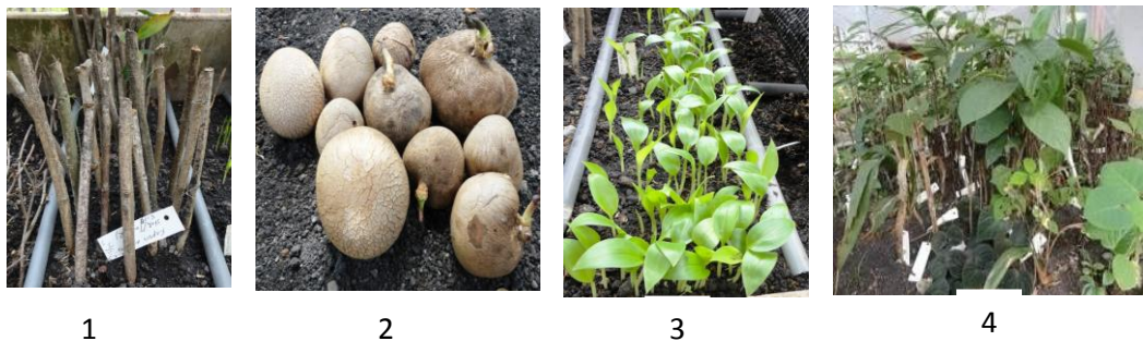
Gambar 1. Beberapa material tumbuhan: 1) material stek, 2) material bulbil, 3) material biji, 4) material split (anakan)

Aklimatisasi dilakukan terhadap material tanaman yang akan dijadikan koleksi di Kebun Raya Purwodadi. Tujuan utama dari aklimatisasi adalah menyiapkan bibit siap tanam untuk koleksi Kebun Raya Purwodadi. Proses aklimatisasi menentukan tingkat kehidupan material yang ditanam. Material tumbuhan dapat berupa vegetatif (seedling, split/anakan, umbi, rhizoma, bulbil dan stek) dan generatif (biji dan spora). Pada material spora ditanam pada media moss dan dibungkus rapat.