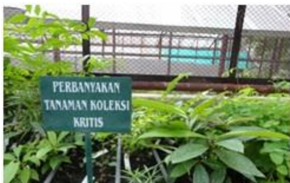
Gambar 4. Perbanyak Tanama kritis

Koleksi kritis merupakan koleksi yang tersisa 1 buah tanaman saja di kebun. Hingga tahun 2012 jumlah koleksi kritis adalah 404 jenis. Tercatat sekitar 37 jenis diperbanyak di seleksi dan pembibitan hingga 2012. Tujuan dari perbanyak adalah untuk menyulam koleksi kritis di kebun. Data koleksi kritis diperoleh dari unit registrasi. Tanaman hasil perbanyak koleksi kritis diaklimatisasi pada ruang pemeliharaan hingga siap ditanam sebagai koleksi di Kebun raya Purwodadi.