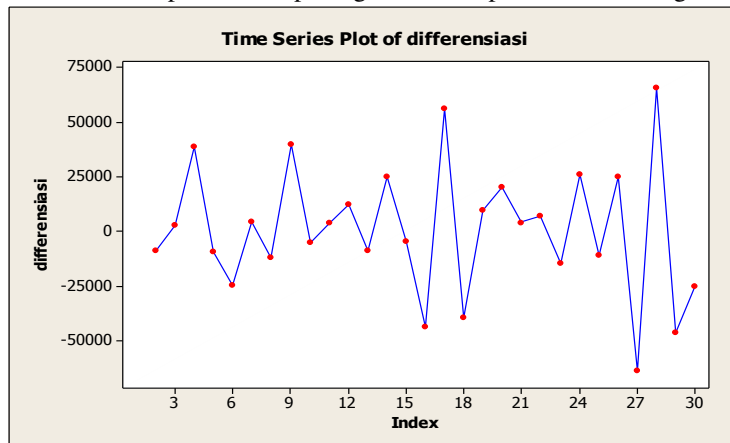
Gambar 2. Grafik data differensiasi

Dan grafik differensiasi dari data permintaan paving di benawa putra adalah sebagai berikut: