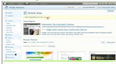
Gambar 2. Proses Membuat Tampilan Tema