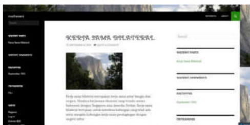
Gambar 7. Blog Nurhasani ( http://anniamblog.wordpress.com/ )