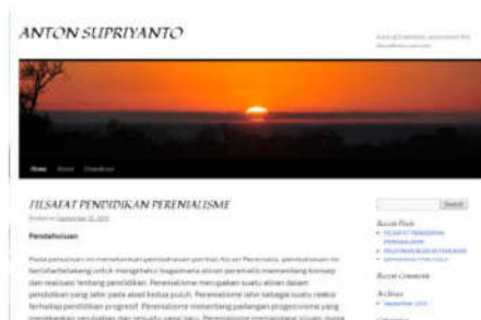
Gambar 6. Blog Anton Supriyanto ( http://antonsupriyanto71.wordpress.com/ )