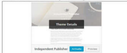
Gambar 1. Proses Membuat Tema pada Blog