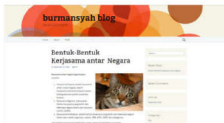
Gambar 5. Blog Burmansyah ( http://burmansyah.wordpress.com/ )

Berikut beberapa tampilan dari para peserta pelatihan pembuatan blog: