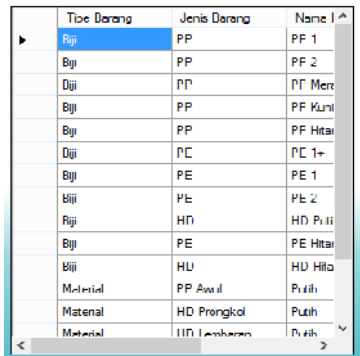
Gambar 9. Tampilan Harga Beli Usulan

Fitur lain yang terdapat pada sistem informasi ini untuk mendukung proses pengambilan keputusan dan proses transaksi adalah fitur harga beli usulan dan peningkat jatuh tempo. Fitur harga beli usulan disertakan untuk membantu pemilik menentukan harga beli saat proses pembelian dan fitur peningkat jatuh tempo disertakan untuk mengingatkan pemilik waktu jatuh tempo yang sudah mau habis. Lamanya durasi jatuh tempo yang ditampilkan adalah seminggu sebelum tanggal jatuh tempo. Gambar 9. merupakan tampilan harga beli usulan dan gambar 10. merupakan tampilan peningkat jatuh tempo