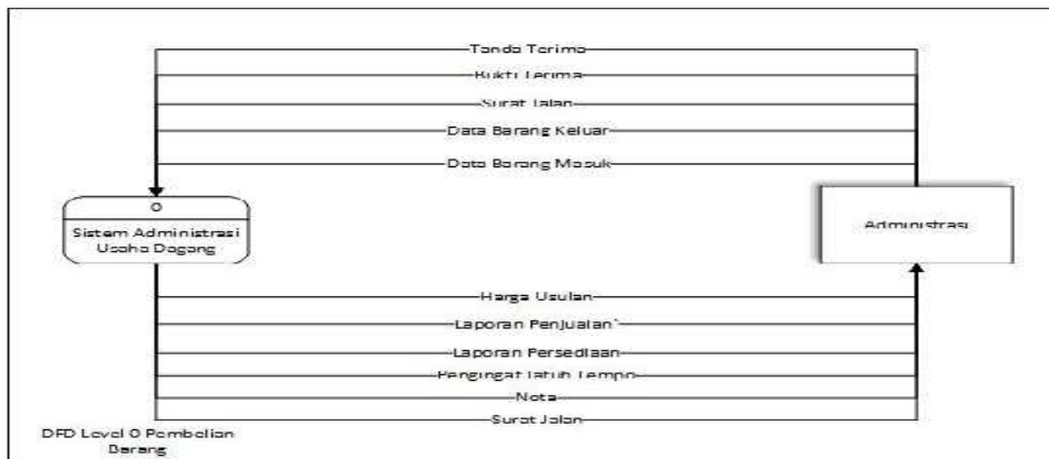
Gambar 1. Context Diagram