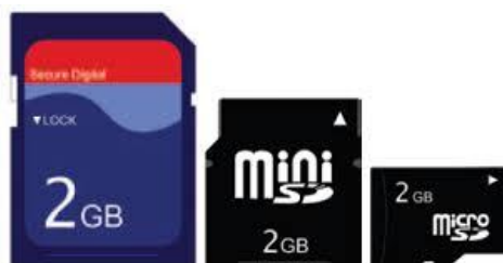
Gambar 2. Secure Digital Card (SD Card)

Secure Digital (SD) adalah sebuah format kartu memori flash. SD digunakan dalam alat portabel, seperti PDA, kamera digital dan telepon genggam. Kartu SD dikembangkan oleh SanDisk, Toshiba, dan Panasonic. Selain memiliki sistem pengaman yang lebih bagus, SD Card juga bisa dengan mudah dibedakan dari MMC karena memiliki ukuran yang lebih tebal dibanding kartu MMC standar. Kartu SD standar memiliki ukuran 32 mm x 24 mm x 2,1 mm, tetapi ada beberapa kartu SD yg setipis MMC (1.4 mm). Dalam perkembangannya, kartu SD diproduksi juga dalam dua variasi ukuran yg lebih kecil, kedua varian tersebut dikenal dengan nama MiniSD dan MicroSD atau TransFlash (T-Flash) . Secara umum, kartu SD dibedakan dari kecepatan transfer data yang tersedia, yaitu kecepatan biasa (150 KB/s) dan kecepatan tinggi ( http://id.wikipedia.org/wiki/Kartu_Secure_Digital ).