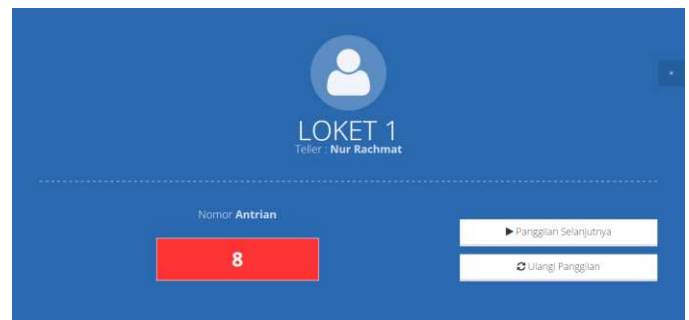
Gambar 4. Implementasi Antarmuka Petugas Loket

Gambar 4 merupakan tampilan dari halaman kontrol petugas loket. Pada halaman ini petugas loket dapat melakukan pemanggilan nomor antrian atau mengulang proses pemanggilan nomor antrian. Gambar 5 merupakan tampilan dari halaman informasi antrian. Halaman ini akan ditampilkan pada layar monitor yang dapat dilihat dengan jelas oleh customer . Pada halaman ini juga proses pemanggilan suara dilakukan dan dilakukan secara bergantian, artinya jika proses pemanggilan dari petugas loket 1 sedang berlangsung maka petugas loket lain harus menunggu hingga pemanggilan dari loket 1 selesai dilakukan.