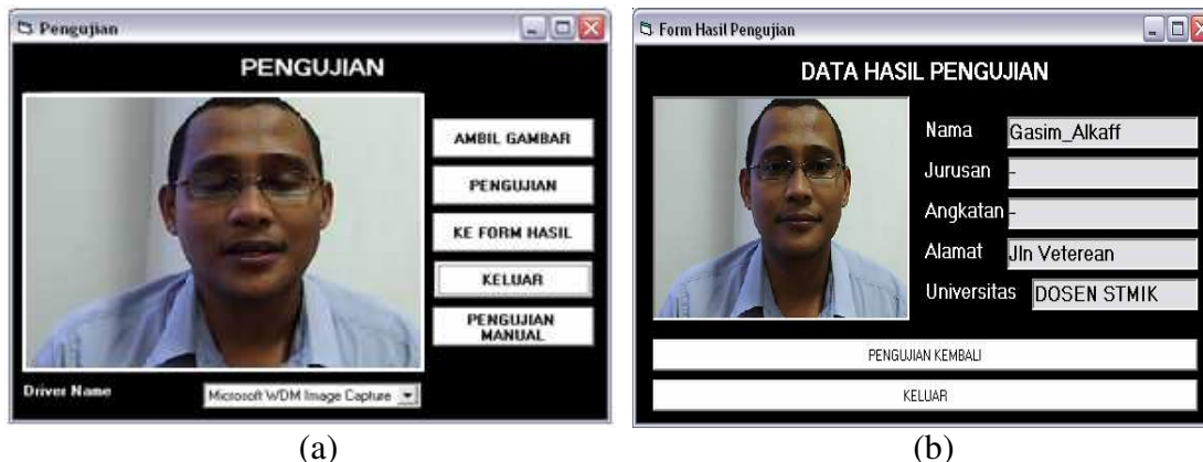
(a) (b) Gambar 4. (a) Tampilan Form Pengujian (b) Tampilan Form Hasil Pengujian