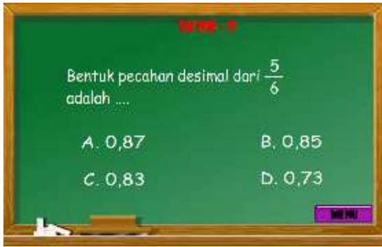
Gambar 4.5 Halaman Level 3

akhir permainan setelah semua soal telah dijawab pada gambar 4.6 dan 4.7.