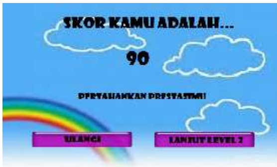
Gambar 4.6 Halaman Hasil Nilai Baik