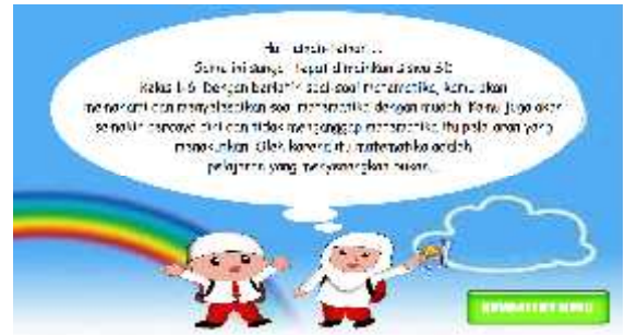
Gambar 4.7 Halaman Tentang Aplikasi MARBEL

Menu tentang pada aplikasi game MARBEL ini berisikan tentang maksud dan tujuan dari pembuatan game ini. Berikut gambar 4.8 tampilan menu level 3.