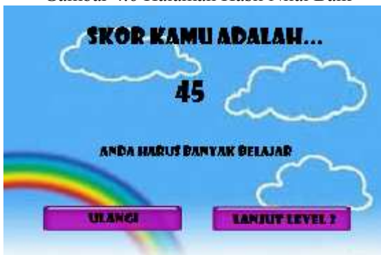
Gambar 4.7 Halaman Hasil Nilai Jelek