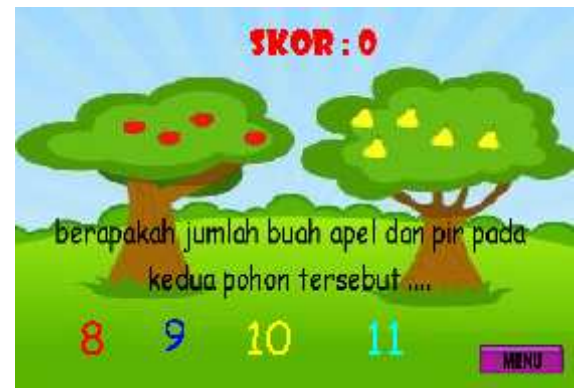
Gambar 4.3 Halaman Level 1

keterangan pada pojok kanan atas yang nantinya untuk menunjukan skor yang didapat oleh pengguna atau user . Berikut gambar 4.3 tampilan menu level 1.