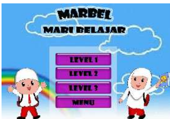
Gambar 4.2 Halaman Menu Mulai

Menu mulai muncul pada saat pengguna atau user menekan atau mengklik tombol mulai pada menu utama. Menu mulai ini terdiri dari aplikasi yang terdiri dari judul aplikasi, gambar di sebelah tombol-tombol level aplikasi, dan tombol musik latar belakang. Pada tampilan menu mulai terdapat tombol kembali ke menu utama. Berikut gambar 4.2 tampilan menu mulai.