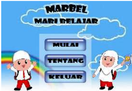
Gambar 4.1 Halaman Utama

Implementasi program akan menjelaskan tampilan-tampilan program aplikasi game MARBEL yang telah diimplementasikan, dan game yang dibuat sesuai dengan perancangan. Gambar 4.1 di bawah ini adalah gambar tampilan menu utama pada aplikasi ini.