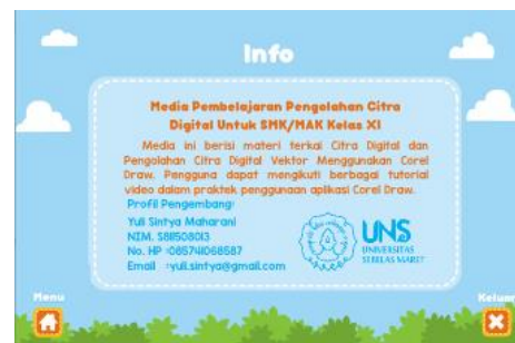
Gambar 5. Tampilan Menu Evaluasi