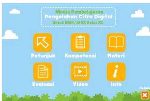
Gambar 3. Tampilan Menu Utama Menu Materi