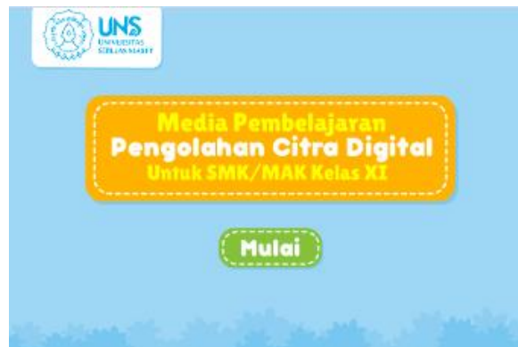
Gambar 2. Tampilan Opening MPI