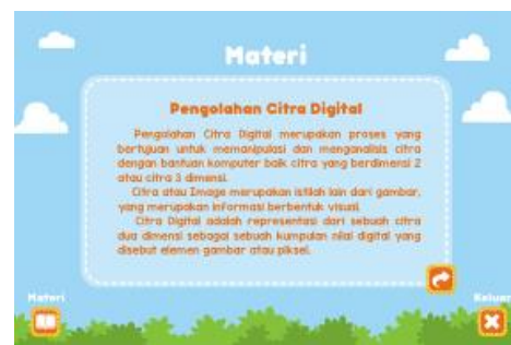
Gambar 4. Tampilan