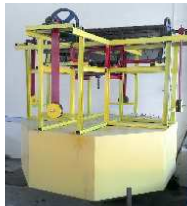
Gambar 3. Hasil rancang bangun

Pada sistim pembangkit ini akan menggunakan empat bandulan untuk menghasilkan putaran yang lebih besar dan lebih stabil.