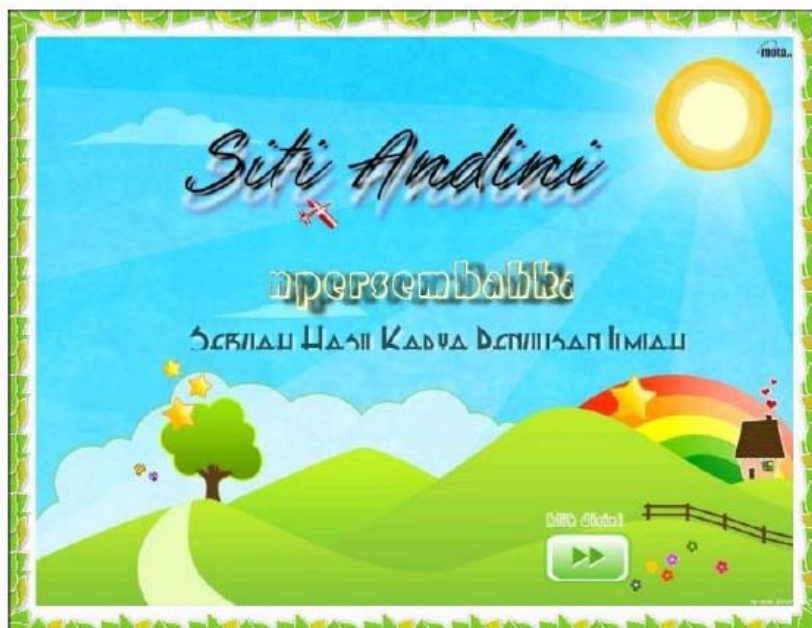
Gambar 3. Tampilan Awal Aplikasi