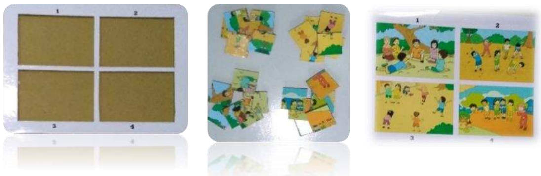
Gambar 1. Media Puzzle Gambar Seri

Model puzzle yang digunakan nantinya berupa puzzle dengan gambar seri yang dapat dilihat pada gambar 1 berikut: