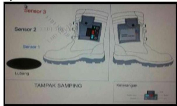
Gambar 1. Sistem Kerja SULTAN

Realita dalam masyarakat bahwasannya penyandang tunanetra selalu mengalami kesulitan termasuk kesulitan untuk memperoleh akses dalam menjalankan kehidupan sehari-hari karena keterbatasan fisik mereka. Namun dengan perkembangan teknologi yang semakin pesat, masalah tersebut dapat di minimalisir. Salah satu teknologi yang telah kami ciptakan adalah SULTAN (Sepatu Sensor Untuk Langkah Tunanetra). SULTAN merupakan sepatu yang mempunyai inovasi karena diberi sensor jarak dan Bluetooth sehingga bermanfaat bagi penyandang tunanetra dan dapat diterapkan sebagai alat untuk membantu mengetahui jarak dari suatu objek dan lubang yang ada di depannya. Cara kerja sepatu ini adalah memakai mikrokontroler arduino, mikrokontroler ini akan menjalankan semua sistem yang ada pada sepatu dan earbud/handsfree tersebut.