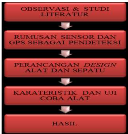
Gambar 2. Diagram Alur Metode Pendekatan dan Pelaksanaan

Langkah awal yang dilakukan adalah observasi ke tempat club robotik dan elektronika serta mencari literatur yang berhubungan dengan robotik itu sendiri. Setelah memperoleh informasi dari tahap awal, selanjutnya membuat rumusan alat sensor dan GPS sebagai pendeteksi untuk langkah tunanetra dan membuat desain prototype sepatu yang digunakan. Lebih jelasnya dapat dilihat pada Gambar 1 di bawah ini :