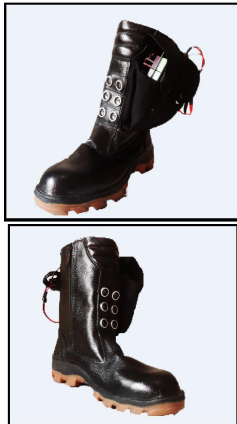
Gambar 5. Design Prototype SULTAN