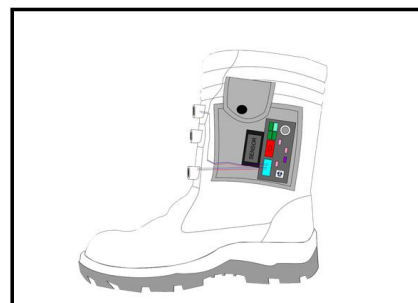
Gambar 7. Desain Alat dan GPS

Meliputi perancangan GPS sebagai pendeteksi titik koordinat posisi tempat yang telah dihubungkan pada pengontrol program yaitu arduino. GPS dipasang terpisah dengan letak arduino yaitu di dalam kotak namun tetap terhubung dengan arduino. Buzzer dipasang dekat dengan arduino sebagai media output. LCD dipasang terpisah dengan letak arduino juga yang berfungsi sebagai media output untuk melihat posisi tempat. SD card dipasang dekat dengan arduino untuk menyimpan data voice . Speaker dipasang dekat dengan GPS sebagai media output. Baterai dipasang dekat dengan arduino sebagai sumber tegangan arduino.