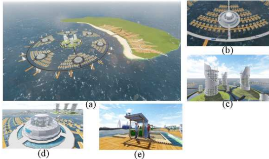
Gambar 1. (a) Materplant J3F (b) Cluster J3F (c) Main Building (d) Research Center (e) Modul J3F