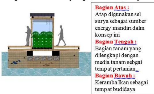
Gambar 2. Detail Modul dari J3F

Jakarta Floating Farm and Fisheries terdiri dari komponen-komponen blok beberapa modul yang dijadikan satu pada masterplan. Secara global struktur dari modul J3F terbagi menjadi 3 bagian, yaitu bagian atas, bagian tengah dan bagian bawah dan memiliki dimensi tertentu. Material utama menggunakan beton apung, bambu dan baja.