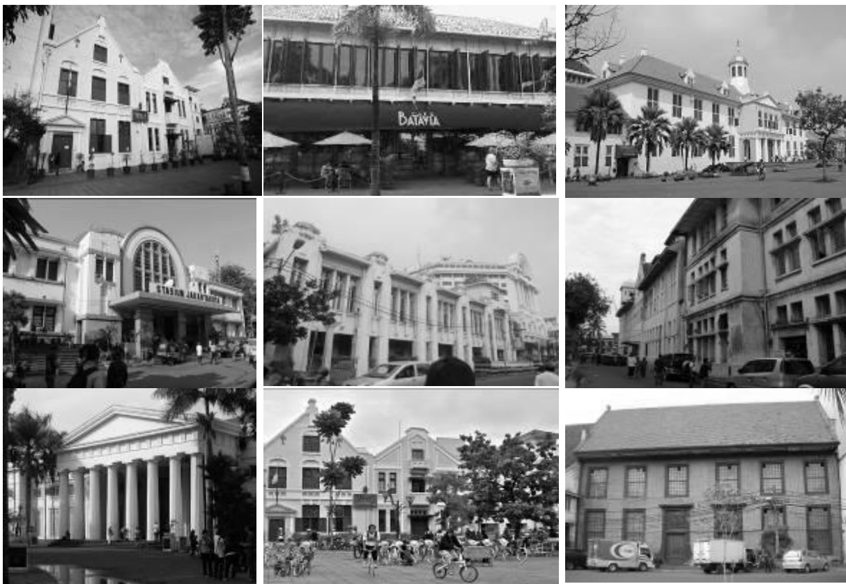
Gambar 2. Visualisasi Bangunan di kawasan Kota tua yang Masih Bertahan

Di titik pusat bagian kawasan kawasan kota tua ini terdapat salah satu tempat di Jakarta yang selalu dijadikan ruang pertemuan warga secara massal, yang merupakan gedung Plaza Fatahillah, juga terdapat Museum Senirupa dimana biasanya di tempat tersebut diadakan berbagai pameran tetap dan temporer, yang tingkat penggunaannya cukup padat, hampir setiap akhir pekan selalu dipenuhi berbagai kegiatan tersebut.