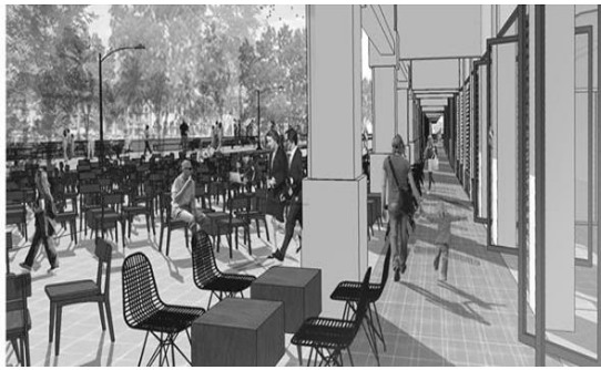
Gambar 5. Konsep Ruang Ekonomi dan Perdagangan