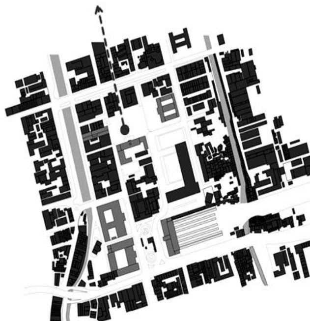
Gambar 4. Ruang Pentas Temporer