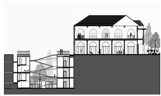
Gambar 6. Gagasan Konservasi Dengan Pendekatan Context-Contrast