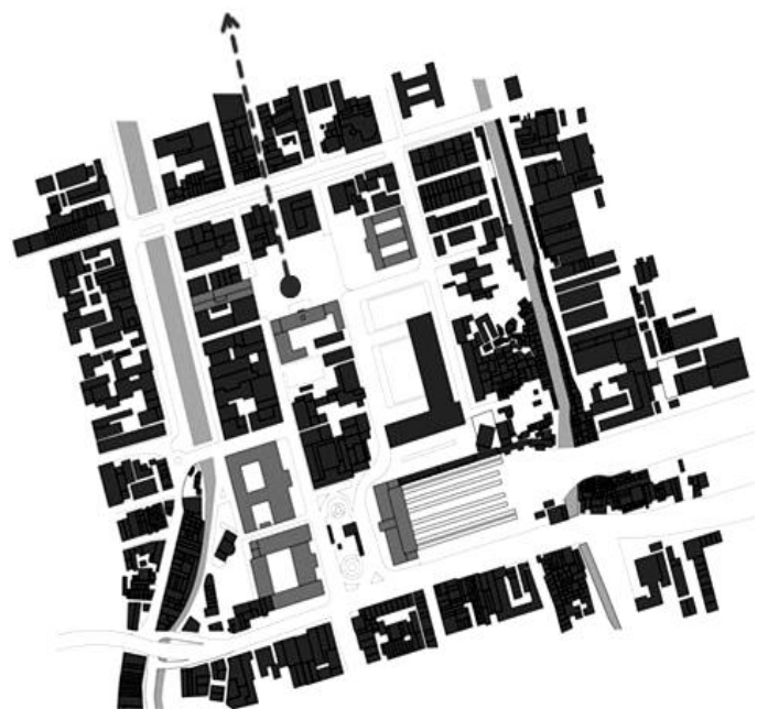
Gambar 3. Ruang Interaksi Masyarakat