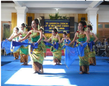
Gambar 2. Kondisi budaya zaman dahulu

penataan kembali agar kebudayaan dan budaya Indonesia tetap dapat diingat dan dilestarikan oleh seluruh masyarakat khususnya di daerah perbatasan.