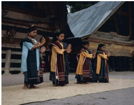
Gambar 6. Pakaian adat Ulos dari Sumatera Utara