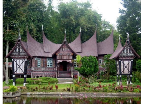
Gambar 5. Rumah gadang, Rumah adat dari Sumatera Barat.