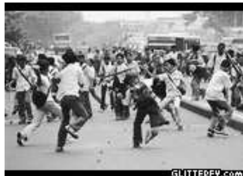
Gambar 3. Kondisi budaya zaman sekarang.

Pengetahuan akan keragaman budaya Indonesia pada seluruh masyarakat di Indonesia khususnya di wilayah perbatasan, akan meminimalisir pengklaiman kebudayaan Indonesia. Kebudayaan Indonesia yang beraneka ragam, beberapa diantaranya kini telah di klaim oleh Negara lain, diantaranya yaitu: