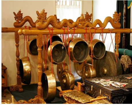
Gambar 4. Alat musik gamelan dari Jawa