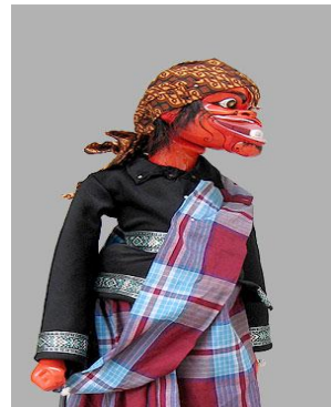
Gambar 7. Wayang golek, kesenian dari Jawa Barat

Akibat dari kurangnya pengetahuan akan budaya dan kebudayaan Indonesia mengakibatkan masyarakat khususnya di perbatasan tidak mengetahui apa saja kebudayaan Indonesia yang pada dasarnya beraneka ragam. Berdasarkan data pengklaiman diatas, telah banyak kebudayaan Indonesia khususnya dibidang kesenian, musik, tari, dan lain-lain yang di klaim oleh Negara lain khususnya Malaysia. Oleh karena itu penulis menggagas sebuah solusi yang mana dapat membantu menyelesaikan permasalahan diatas. Rumah Indonesia merupakan sebuah gagasan penulis yang terinspirasi dari sebuah perfileman Indonesia yang menceritakan tentang masyarakat yang ada diperbatasan dan lebih memilih menjadi warga Negara Malaysia dengan melakukan segala aspek baik ekonomi, sosial, maupun budaya Malaysia.