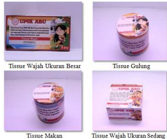
Gambar 3. Aneka Produk Tissue aroma terapi

yang menjadi ciri khas Indonesia. Setelah semua tahap produksi selesai dan menghasilkan produk Tissue Aroma terapi Upik Abu, Produk siap untuk dipasarkan. Produk akhir dapat dilihat pada Gambar 3 di bawah ini,