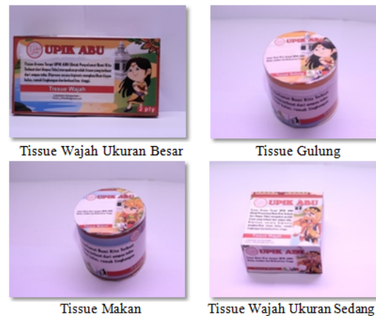
Gambar 3. Aneka Produk Tissue aroma terapi

yang menjadi ciri khas Indonesia. Setelah semua tahap produksi selesai dan menghasilkan produk Tissue Aroma terapi Upik Abu, Produk siap untuk dipasarkan. Produk akhir dapat dilihat pada Gambar 3 di bawah ini,