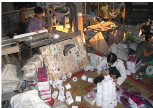
Gambar 2. Tahap finishing pembuatan Tissue Aroma Terapi “Upik Abu”

Kemudian setelah bahan dasar didaur ulang dan telah layak untuk dijadikan sebagai bahan pembuat tissue , dilakukan proses pembuatan tissue. Proses pembuatan tissue meliputi menumbuk ampas tebu sampai tinggal seratnya, Memasak tumbukan ampas tebu tersebut dengan menggunakan asam asetat dan air. Mencuci hasil pemasakan ampas tebu tersebut dengan menggunakan air bersih agar kandungan asam asetat dalam ampas tebu tersebut habis, Memisahkan serat mandiri ampas tebu menjadi serat-serat halus dilakukan dengan cara disintegrasi, Menyaring serat halus ampas tebu kemudian mengeringkannya, Membuat lembaran kertas Tissue dengan memperhatikan ketebalan Tissue yang dikehendaki, Penambahan aroma perfume. Berikut ini gambar proses finishing tissue.