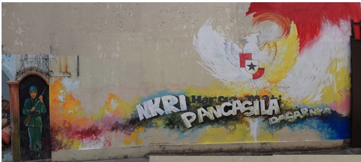
Gambar 6. Pemenang Juara Harapan 3

STP memaknai bahwa walaupun suku-suku bangsa itu memiliki budaya yang berbeda-beda, semuanya menyatu membentuk bangsa Indonesia. Tapi karena adanya kekerasan SARA bisa memecah belah negara, dan masyarakat Indonesia akan jauh dari arti Bhinneka Tunggal Ika yang berarti “Berbeda-beda tetapi tetap satu jua” walaupun ada banyak ragam budaya seharusnya bangga, dan saling menghargai bahkan saling mempelajari budaya daerah lain bukan malah meledek, merasa budayanya yang paling unggul. Deskripsi tersebut untuk melengkapai penjelasan dari mural