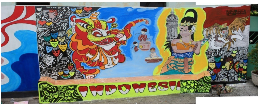
Gambar 9. Penghargaan sebagai partisipan 3