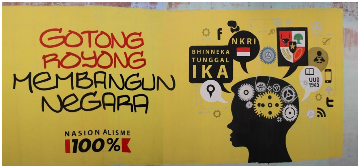
Gambar 4. Pemenang Juara Harapan 1

AS memaknai tulisan setia NKRI dan PANCASILA PEMERSATU BANGSA memberi arti bahwa negara Republik Indonesia mempunyai keragaman budaya sebagai satu kesatuan yang kokoh dan Pancasila sebagai lambang negara Indonesia. AS memaknai peta Indonesia yang menggambarkan Bhineka Tunggal Ika walaupun berbeda-beda tapi tetap satu jua dengan banyaknya aneka ragam budaya dan adat istiadat di Negara Indonesia tetap bersatu. Selanjutnya lambang negara Burung Garuda dengan kibaran bendera Merah Putih dimaknai menggambarkan ideologi negara. Dalam kehidupan bangsa Indonesia diakui bahwa Pancasila