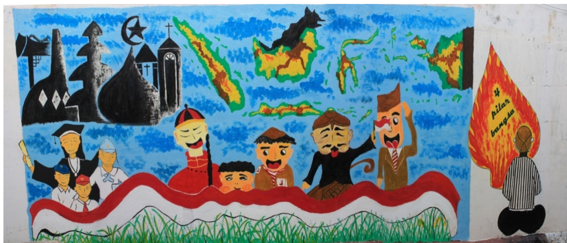
Gambar 5. Pemenang Juara Harapan 2