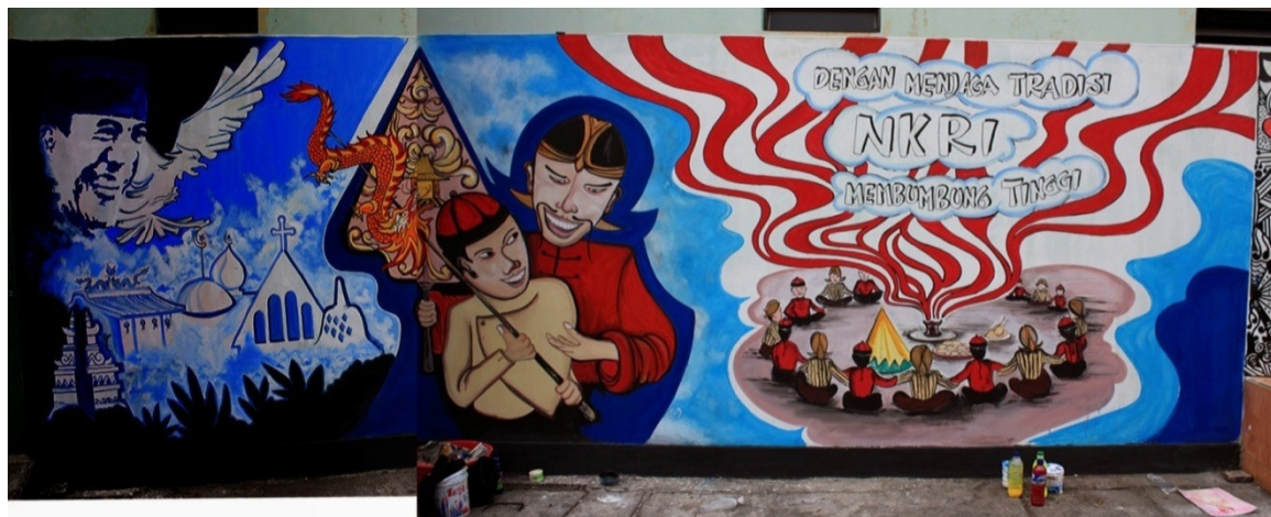
Gambar 3. Pemenang Juara 3