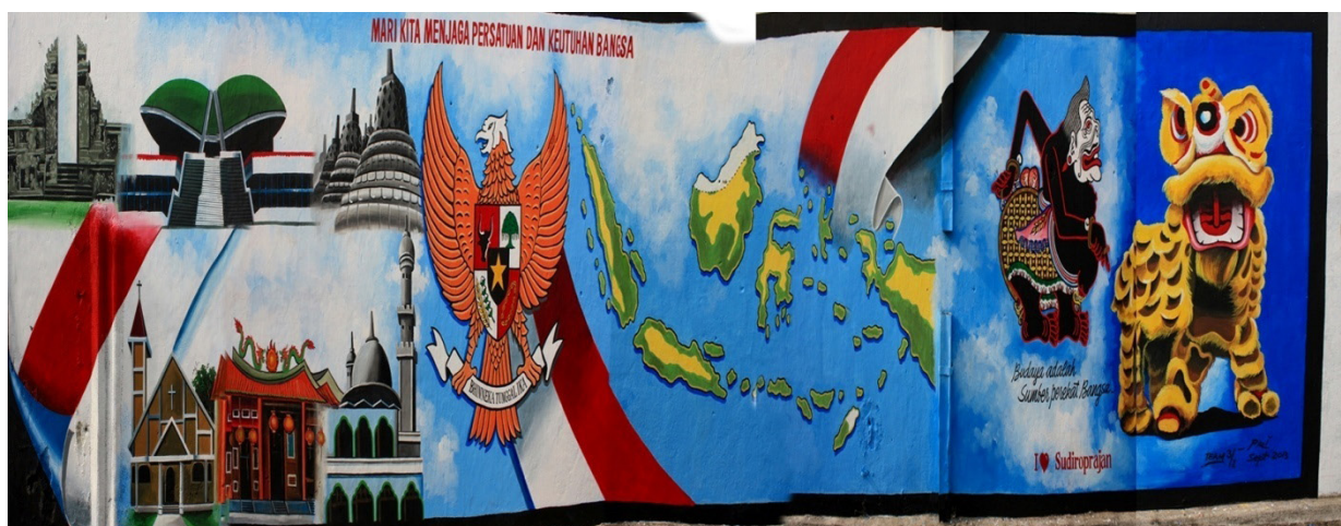
Gambar 1. Pemenang Juara 1

telah mampu mereduksi kekuatan dalam mengatasi perbedaan. Temuan lapangan menunjukkan bahwa Pengembangan Model Pendidikan, yang berbasis local wisdom (Geertz, 1983) yang berkembang atas dasar pengetahuan dan pemahaman masyarakat setempat). Melalui model Pendidikan tersebut telah dapat melibatkan partisipasi secara luas dan sepenuhnya dari masyarakat khususnya dalam rangka memahami dan mengimplementasikan 4 Pilar Bangsa dalam kehidupan sehari-harinya. Mereka secara partisipasi aktif mulai dari aktifitas merencanakan kegiatan, melaksanakan dan memonitoring serta mengevaluasi apapun kegiatan yang telah mereka lakukan. Tim bersama Lurah dan LPMK menyepakati agar kegiatan penelitian UNS bekerjasama dengan Pokdarwis; mensosialisasikan dan memasang spanduk dalam tempo 1 hari, serta dilakukan melalui pengurus RT dan RW, dan ternyata memperoleh sambutan positif dari warga dengan secara informal telah langsung mencari dan memperoleh ijin penggunaan media tembok, serta sekaligus mendaftar menjadi peserta lomba dan secara gethok tular disampaikan kepada warga lain. Diantaranya segera memulai, dan diikuti warga yang lain. Melalui media mural, ternyata masyarakat lebih mudah memahami pesan dan makna empat pilar bangsa. Misalnya SP memaknai gambar Semar dan Barongsai sebagai kerukunan dari etnis yang berbeda yaitu Jawa (Pribumi) dan