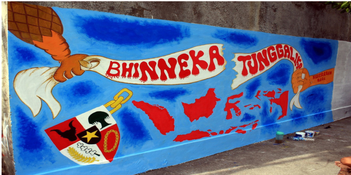
Gambar 8. Penghargaan sebagai partisipan 2

Warga Sudiroprajan selain menggambar, memberikan makna, sekaligus mengambil hikmah dari lomba mural, sebelumnya yaitu tembok yang tampak kotor menjadi tambah bersih, enak dipandang. Mereka telah melaksanakan dan menentukan kriteria penilaian, serta melakukan pengawasan antarpeserta sendiri. Kegiatan umumnya memperoleh sambutan positif dari warga masyarakat, sehingga muncul multiplier effect . Tembok yang sebelumnya tampak kotor dan tidak terawat menjadi terlihat bersih dan enak dipandang, dan setelah menjadi objek mural, akhirnya warga