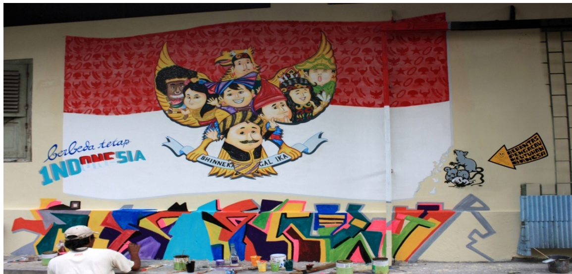
Gambar 2. Pemenang Juara 2

ANG menggambarkan dalam bentuk Nasionalisme pada gambar 4. RZ memaknai gambarnya dengan perbedaan memperin-