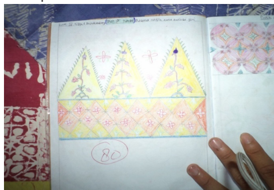
Sumber : Data Primer, hasil Penelitian, 2011 Gambar 1. Motif Bunga Ceplok hasil gambar siswa

Setelah saya gambar di papan tulis saya baru menjelaskan ini misalnya anak-anak ini motif kembang ceplok. Motif kembang ceplok adalah motif jawa. Cara menggambarannya adalah dimulai dengan membuat lingkaran ditengahnya kemudian membuat setengah lingkaran yang berada di sisi lingkaran tengah. Setelah saya selesai mencontohkan menggambar pada anak-anak kemudian anak-anak saya suruh menggambar motif yang telah saya contohkan di kertas gambar.( Hasil Wawancara dengan Ibu Jarwati, 41 tahun, Guru pada tanggal 24 April 2011)