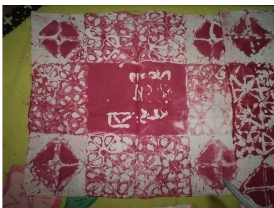
Gambar 3. hasil kain batik yang dibuat oleh anak-anak kelas enam SD Dorokandang 2

Proses selanjutnya yaitu melorot . Melorot ini merupakan tahapan selanjutnya ketika proses pewarnaan telah dilakukan. Proses melorot ini juga hampir sama dengan proses pewarnaan. Yaitu menyiapkan air mendidih untuk merebus kain yang telah diwarnai. Tujuannya yaitu melunturkan malam yang ada pada kain sehingga akan kelihatan motif batik tulis Lasem yang bagus. Proses melorot ini dapat dilakukan dalam sekali pertemuan tentunya yang melakukan adalah anak-anak kelas enam dengan arahan Ibu Jarwati.