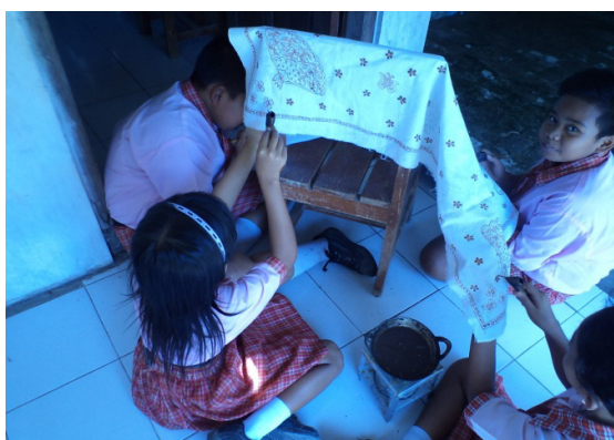
Gambar 5. Tahap nglengkrenng yang dilakukan siswa SD Jolotundo 2

Pelaksanaan praktik membatik tulis Lasem tahap selanjutnya yaitu tahap nblengkrenng, nerusi, dan isen-isen. Dari ketiga tahap ini bahan dan alat yang digunakan sama. Ibu Nur menjelaskan dan mengarahkan kepada anak-anak selain hal tersebut juga mendampingi anak-anak melakukan praktik ini. Tahap nglengkrenng merupakan tahap menorehkan malam pada kain mori yang telah digambar motif. Pada tahap ini banyak yang harus dipelajari anak-anak yaitu seperti bagaimana cara memegang canting yang benar. Anak-anak juga diajari bagaimana melihat malam yang sudah dapat dipakai. Pada tahap ini anak-anak melakukan secara bergantian.