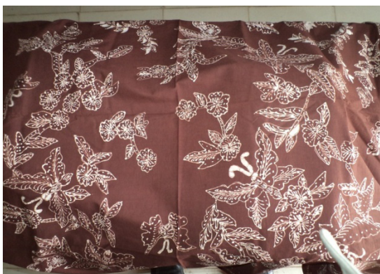
Gambar 14. hasil karya siswa SD karasgede

Pada proses pewarnaan dan melorot pada kelas enam tetap saya jelaskan. Saya memperagakan bagaimana cara mewarnai kain batik dan bagaimana cara melorot malam pada kain batik. Alat dan bahan yang digunakan pada tahap ini juga saya jelaskan. Namun pada praktik ini ketika saya memperagakan tidak menggunakan bahan pewarna. Hanya sekedar memperagakan dan saya jelaskan pada anak-anak langkah-langkah untuk mewarnai kain batik dan melorot malam pada kain batik. (Hasil wawancara dengan Ibu Diarty, 51 tahun, kepala sekolah, pada tanggal 27 Maret 2011)