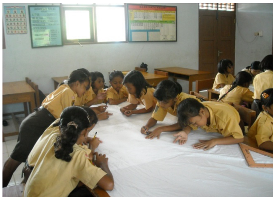
Sumber : Dokumentasi SD Karasgede, Gambar 11. anak-anak membuat motif pada kain dengan pensil.

sehingga terdapat beberapa harga kaon mori yang berbeda. Mendapat kain kain mori ini dapat dibeli di toko kain maupun pengusaha batik.