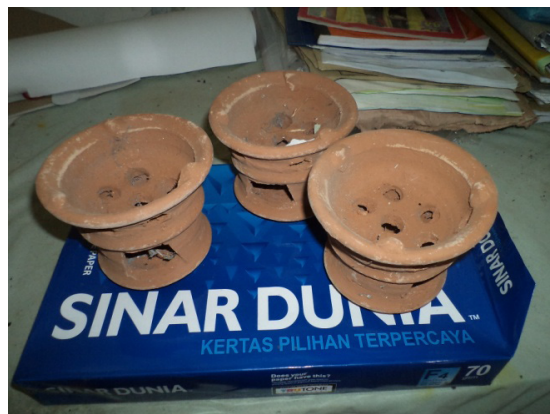
Gambar 4. kompor untuk memanasi malam dengan menggunakan arang.

Penjelasan alat-alat dan bahan yang dipakai saya lebih suka dengan membawa alat-alat tersebut secara langsungkemudiansaya mempraktikan beberapa alat yang penting digunakan. Sambil saya mepraktikan saya juga menjelaskn kegunaan alat dan bahan tersebut. (Hasil wawancara dengan Ibu Nur, 26 tahun, guru pada tanggal 10 April 2011).