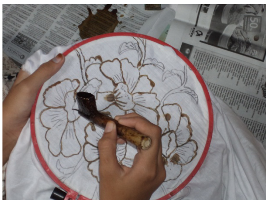
Sumber : Data primer, hasil penelitian 2011 Gambar 17. tahap nglengkeng siswa SD Selopuro 2

Setelah selesai memola anak-anak melanjutkan pada pertemuan berikutnya yaitu nglengkeng atau disebut juga menorehkan malam pada kain. persiapan yang dilakukan sebelum tahap ini yaitu menyiapkan kompor kecil dan wajan yang digunakan untuk memanasi malam. Biasanya persiapan ini dilakukan pada jam istirahat sebelum mulai masuk pada jam pembelajaran. Pada saat memasuki jam pelajaran malam yang telah dipanaskan sudah siap untuk digunakan. Praktik nglengkeng ini juga dilakukan anak-anak secara bergantian agar dapat merasakan semua. Arahan demi arahan diberikan oleh Ibu Sri Kepada anak-anak kelas lima agar tidak mengalami kesalahan dalam hal menorehkan malam pada pola. Pada saat pelaksanaannya terdapat anak-anak yang membatik dan ada juga anak-anak yang sedang membetulkan canting yang buntu. Langkah ini dilakukan secara bergantian pada seluruh anggota kelompok. Praktik ini tidak hanya membutuhkan praktik sekali pertemuan namun membutuhkan waktu paling tidak dua kali pertemuan.