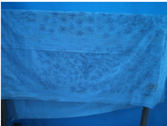
Gambar 8. kain batik hasil siswa yang masih di gambar dengan pensil.

Pada tahap membatik pada kain anak-anak sudah pada mahir membuat pola batik pada kain. Membuat pola pada sehelai kain putih menggunakan pensil dan kertas karbon tidak membuat anak-anak mengalami kesulitan. Di dalam membuat pola batik tulis pada kain anak-anak SD Karangturi membutuhkan waktu kurang lebih dua sampai tiga kali pertemuan. Dalam membuat pola dengan pensil butuh langkah kehati-hatian agar pola yang digambar tidak mengalami kesalahan. Rasa sabar pada anak-anak memang dilatih pada tahap ini.