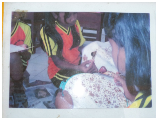
Gambar 9. proses anak-anak sedang melakukan tahap nglengkeng .

suruh untuk membantu temannya ketika temannya mengalami kesulitan. Pada praktik nglengkeng saya hanya membutuhkan dua sampai tiga kali pertemuan. (Hasil wawancara Ibu Muslimah, 50 tahun, pada tanggal 11 April 2011)