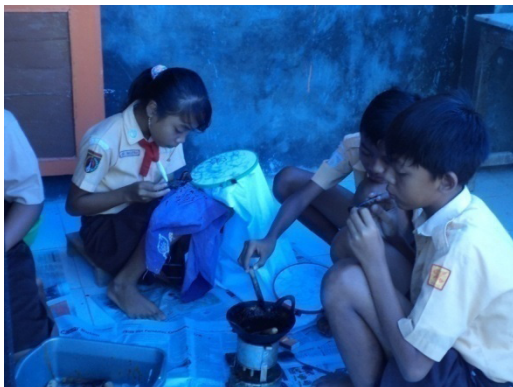
Gambar 19. proses ujian praktik membatik

Pada hari kedua anak-anak mulai praktik membatik. Pelaksanaannya berada dirua membatik SD Selopuro 2. Ruangan ini berisi peralatan membatik yang lengkap. Anak-anak membatik menggunakan pemedang sebagai pengganti gawangan yang biasa dipakai oleh para pembatik. Ujian ini dilakuakn secara bergantian sama anak-anak yang lain dalam satu kelompok. Penilaian yang dilakukan adalah secara individu sehingga satu kelompok merasakan cara membatik seluruhnya.