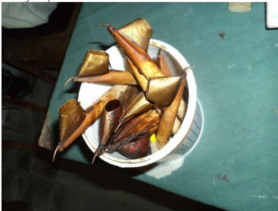
Gambar 13. canting alat untuk membatik.

sesuai dengan pola yang dibutuhkan. Jenis canting yang ketiga yaitu canting yang digunakan buat isen-isen , lubang canting ini besar, agar malam yang dikeluarkan lebih banyak.