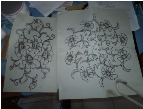
Gambar 18. Pola batik yang akan digambar siswa kelas enam ujian praktik membatik muatan lokal batik tulis Lasem

Pada hari kedua anak-anak mulai praktik membatik. Pelaksanaannya berada dirua membatik SD Selopuro 2. Ruangan ini berisi peralatan membatik yang lengkap. Anak-anak membatik menggunakan pemedang sebagai pengganti gawangan yang biasa dipakai oleh para pembatik. Ujian ini dilakuakn secara bergantian sama anak-anak yang lain dalam satu kelompok. Penilaian yang dilakukan adalah secara individu sehingga satu kelompok merasakan cara membatik seluruhnya.