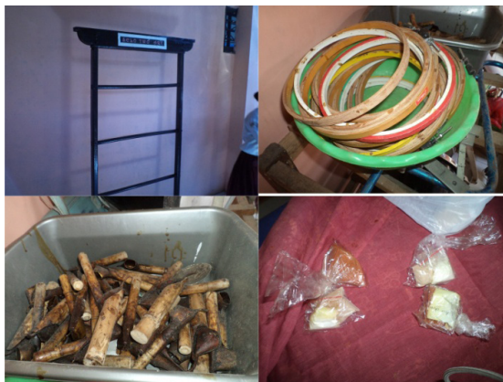
Gambar 15. Alat-alat dan bahan membatik tulis Lasem.

digunakan untuk menorehkan malam pada kain mori yang telah digambari pola. Ibu Nani juga menjelaskan beberapa macam canting dan fungsi dari masing-masing canting tersebut. Disekolah SD Selopuro memiliki jenis canting yang lengkap, seringanya mengikuti perlombaan batik sehingga SD Selopuro diharuskan untuk memiliki peralatan yang lengkap dalam hal membatik.