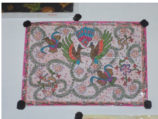
Gambar 16. hasil gambar siswa kelas empat SD Selopuro 2

Materi tentang sejarah batik tulis Lasem ini terdapat perbedaan dengan materi sejarah pada kelas empat. Pada tingkat kelas enam materi sejarah batik tulis Lasem lebih dibahas secara mendalam. Metode pembelajaran yang dipakai oleh Ibu Sri yaitu dengan metode ceramah. Setelah selesai menjelaskan baru mendekte pada anak-anak agar anak-anak memiliki catatan.