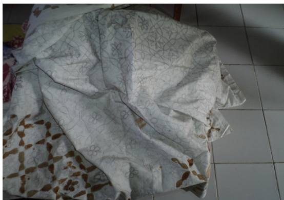
Gambar 2. Hasil tahap nglengkeng kelas 5 SD Dorokandang 2

Tahap berikutnya yaitu tahap nglengkeng , tahap ini merupakan tahap dimana menorehkan malam pada kain. alat yang digunakan yaitu canting. Bahan yang digunakan yaitu malam. hal-hal yang dilakukan siswa ketika praktik pada tahap ini yaitu harus memanasi malam terlebih dahulu sebelum ditorehkan malam pada kain. tahap ini merupakan tahap yang sulit dan sering membuat anak-anak melakukan kesalahan. Banyak materi yang dapat dijelaskan pada tahap ini seperti bagaimana cara penggunaan canting dan jenis-jenis canting yang dapat dimanfaatkan pada tahap ini.