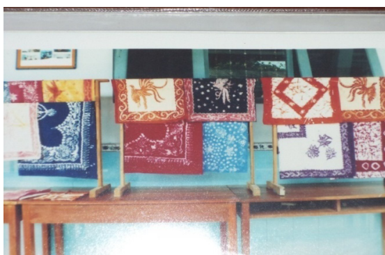
Gambar 22. Pameran batik di SD Karangturi