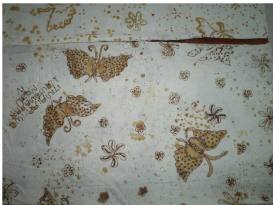
Gambar 10. Hasil kain batik dari tahap isen-isen.

Gambar diatas adalah hasil dari praktik membatik yang dilakukan oleh siswa Sd Karangturi. Motif yang digambar oleh siswa SD karangturi adalah motif kupu-kupu. Kain batik ini nantinya akan dipakai oleh siswa sebagai seragan sekolah Sd karangturi.