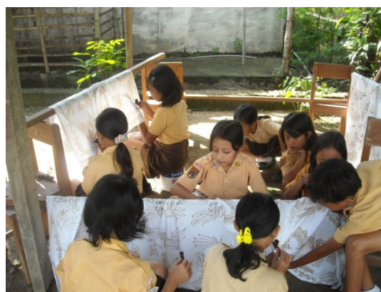
Gambar 12. anak-anak sedang nglengkeng.

membatik tahap ini menjadi penting harus dikuasai oleh anak. Tahap nglengkeng merupakan bagian yang sulit bagi anak-anak yang baru belajar. Masalah yang sering terjadi pada anak yaitu bu cantingnya buntu, bu malamnya mblobor, bu saya salah menggambar. Kalau sudah menggambar dengan malam ketika terjadi kesalahan dalam meggambar itu susah untuk menghapusnya sehingga tahap ini memang benar-bener saya perhatikan. Saya menjelaskan bagaimana cara memegang canting yang benar. Melihat canting itu buntu atau tidak, bagaimana cara menorehkan malam dengan canting pada kain, langkah ini benar saya ajarkan pada anak-anak. (Hasil wawancara dengan Ibu Diyarti, 51 tahun, kepala sekolah, pada tanggal 27 Maret 2011)