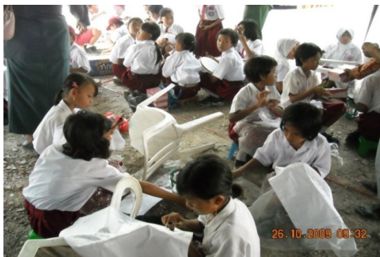
Gambar 21. pada saat lomba batik di Kabupaten Rembang.

yaitu untuk menggugah para pendidik atau pengajar agar dapat melihat hasil karya anak-anak sekolah dasar SD Karangturi dalam hal membatik.