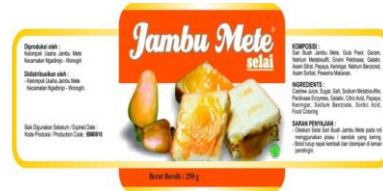
Gambar 7. Label Kemasan Selai