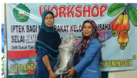
Gambar 2. Pelaksanaan Workshop dan Penyerahan Alat-Alat Produksi Kelompok Usaha Mete Kerjo Utomo Dukuh Thukluk Ngadirojo Wonogiri tanggal 19 Oktober 2016

Pada hari Rabu 19 Oktober 2016 di kelompok Usaha Mete Kerjo Utomo dukuh Thukluk dan Kamis 20 Oktober 2016 di kelompok Usaha Tani Makmur III Dukuh