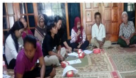
Gambar 3. Pelaksanaan Workshop dan Penyerahan Alat-Alat Produksi Kelompok Usaha Tani Makmur III Dukuh Gayam Ngadirojo Wonogiri tanggal 20 Oktober 2016