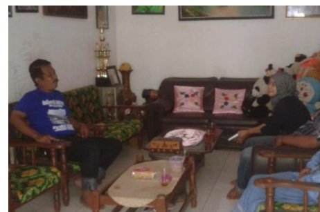
Gambar 1. Koordinasi dengan Ketua Kelompok Usaha Tani Makmur III dan Ketua Kelompok Usaha Mete Kerjo Lor

Mencari mitra usaha sebagai pengusul, yang benar-benar termotivasi ingin mengembangkan usaha namun kesulitan/