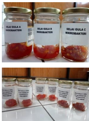
Gambar 6. Uji Masa Simpan dan Mikrobiologi