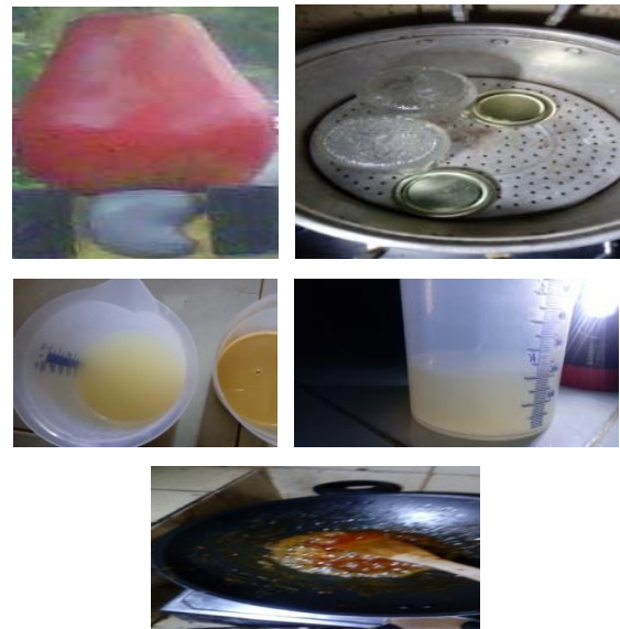
Gambar 4. Proses Pembuatan Selai

Hasil luaran yang diharapkan dari program ini adalah, produk selai jambu mete sesuai syarat mutu. dan jurnal pengabdian masyarakat.