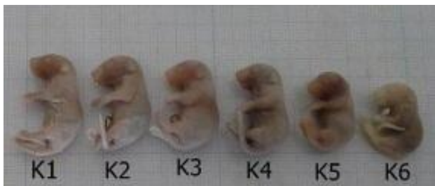
Gambar 2. Morfologi fetus mencit yang mengalami penurunan bb. K1 fetus dari kelompok kontrol, K2 fetus dari kelompok pembanding, K3 fetus dari kelompok perlakuan dosis 40mg/kgbb, K4 fetus dari kelompok

Keterangan: huruf yang sama di belakang angka menunjukkan tidak ada beda nyata. Pada uji Duncan, p < 0,05