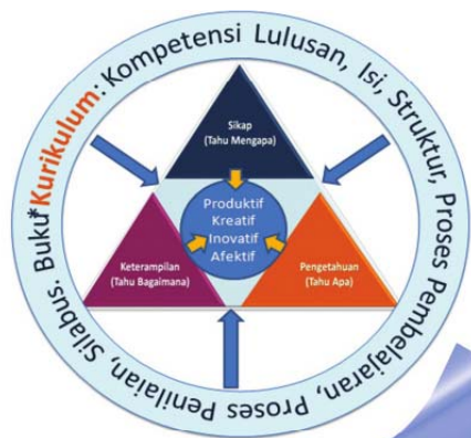
Gambar 5 Posisi Kurikulum 2013 (Sumber: Kementerian Pendidikan dan Kebudayaan, 2012)