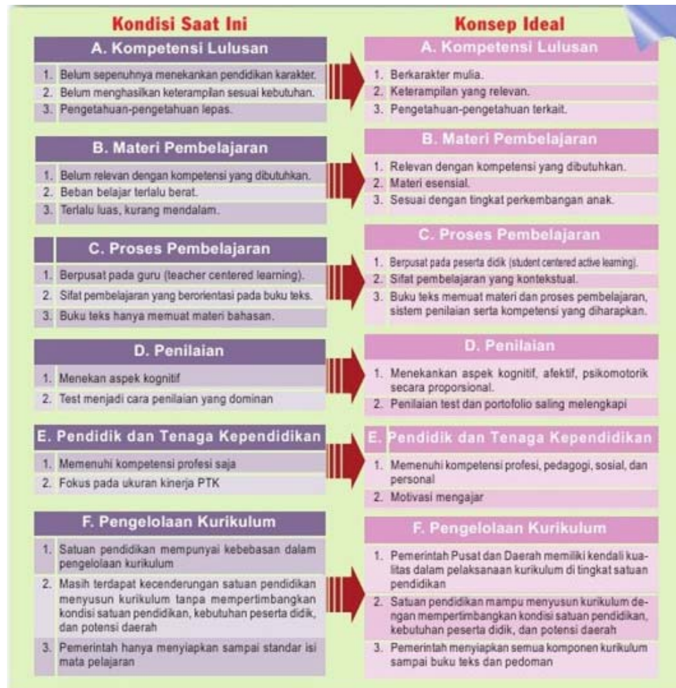
Gambar 2 Identifikasi Kesenjangan Kurikulum

pada dasarnya zaman selalu berubah. Oleh karena itu kurikulum pendidikan harus pula disesuaikan dengan perubahan dan tuntutan zaman. Saat ini yang dituntut adalah kurikulum yang lebih berbasis pada penguatan penalaran, bukan lagi hapalan semata. Gambar 2 menunjukkan tentang kesenjangan kurikulum yang ada pada konsep kurikulum saat ini dengan konsep ideal yang diinginkan. Kurikulum 2013 yang dikembangkan saat ini mengarah ke konsep ideal dimaksud.