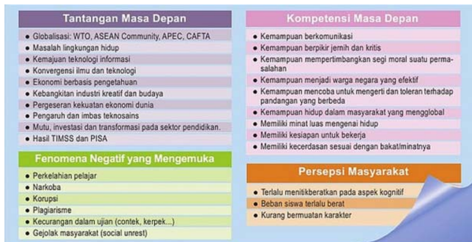
Gambar 1 Alasan Pengembangan Kurikulum

Selain dari hal yang telah dikemukakan, ada beberapa hal lain yang mendasari pengembangan kurikulum 2013. Tantangan masa depan yang harus dihadapi dan tidak bisa dihindari, kemampuan atau kompetensi yang harus dimiliki siswa pada masa depan, fenomena negatif yang akhir-akhir ini terus mengemuka, dan persepsi masyarakat terhadap keberadaan kurikulum yang diberlakukan saat ini merupakan hal-hal yang menjadi pertimbangan disusunnya kurikulum 2013 seperti yang digambarkan pada Gambar 1 sebagai berikut.