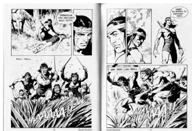
Gambar 4 Isi Buku Komik Indonesia “Bunuh Mandala” karangan Mansyur Daman

Komik jenis ini adalah komik yang disajikan dalam sebuah buku tersendiri dan terlepas dari bagian media cetak lain seperti komik strip dan komik kartun. Buku komik termasuk dalam jenis buku fiksi. Isi buku ini merupakan cerita fiksi yang tidak berdasarkan dengan kehidupan nyata. Buku komik di Indonesia dekat dengan istilah cergam, sejenis komik atau gambar yang diberi teks. Teknik menggambar cergam dibuat berdasarkan cerita dengan berbagai sudut pandang penggambaran yang menarik. Menurut Oxford Dictionary , buku adalah kumpulan kertas atau bahan lainnya yang dijilid menjadi satu pada salah satu ujungnya yang berisi tulisan atau gambar. Setiap sisi dari sebuah lembar kertas pada buku disebut halaman.