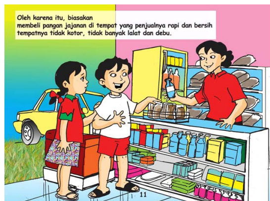
Gambar 7 Komik Edukasi Jajan Sehat

Selain menjadi media edukasi, komik pun hadir sebagai media pendukung promosi produk. Pada umumnya, komik jenis ini menampilkan sebuah cerita satu halaman saja dan biasanya disajikan dalam sebuah majalah. Biasanya, dengan kepentingan promosi sebuah produk, produsen menciptakan seorang tokoh komik yang membawakan produk mereka. Sebut saja salah satunya produsen es krim, Walls, dalam mempromosikan Paddle Pop membuat karakter tokoh animasi berkarakter singa yang selalu berpetualang. Media Promosi ini dilakukan dengan sangat matang. Promosi berawal dari produk makanan yang disampaikan dengan cerita komik hingga menembus pasar layar lebar film animasi di tanah air.