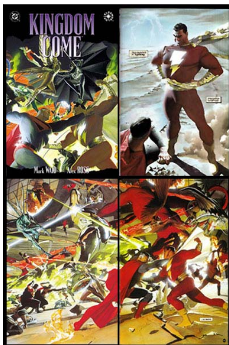
Gambar 6 Novel Grafis “Kingdom Come” Mark Waid dan Alex Ross

Komik-komik yang beredar pada saat ini pun juga beragam dalam jenis cerita. Pada dasarnya komik adalah sumber dari inspirasi seorang komikus dalam menyampaikan cerita atau berita aktual yang sedang terjadi. Akan tetapi, komik juga menjadi wadah pembelajaran bagi anak-anak yang dikemas sangat menarik minat membaca. Komik menjadi sebuah media yang penyampaian isi dituangkan ke dalam gambar sederhana namun tetap memiliki makna yang sangat luas yang menggabungkan pola pikir intelektual dan artistik seni. Gambar dan cerita menjadikan sebuah media pesan yang beragam. Sebuah komik yang baik harus memiliki fungsi yang baik pula, selain memiliki fungsi menghibur, sebuah komik pun juga harus memiliki fungsi yang meng edukasi para pembacanya, selalu memiliki pesan moral yang ingin disampaikan. Kedudukan komik makin berkembang dengan baik di masyarakat yang sudah menyadari nilai komersial dan edukatif yang dibawanya (Bonnet, 1998:67).