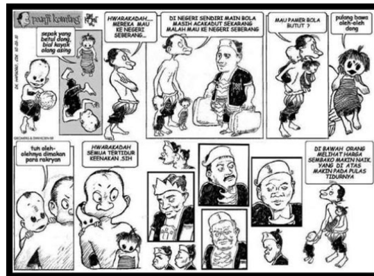
Gambar 3 Komik Strip Kartun “Panji Koming” Harian Kompas Minggu

Komik strip lainnya adalah komik strip kartun. Biasanya komik strip jenis ini menceritakan sindiran terhadap isu-isu yang sedang terjadi di tengah masyarakat namun disajikan dengan pendekatan humor. Tokoh utama memiliki bentuk lucu atau ciri khas tertentu; lucu namun dekat dengan masyarakat yang mengundang tawa para pembacanya. Meskipun penyampaian komik strip kartun ini mengundang tawa, pesan yang disampaikan penuh makna dan serius, sehingga memerlukan sebuah kajian lebih dalam dari para penikmat kartun strip ini. Bonnef (1998) menyebutkan bahwa jenis komik kartun ini sebagai komik intelektual.