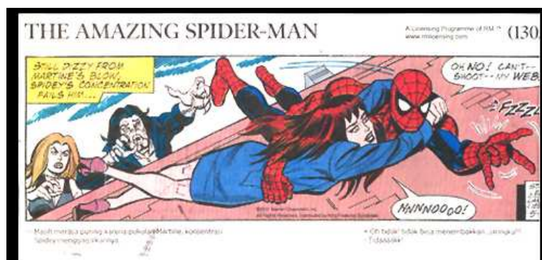
Gambar 2 Komik Strip "The amazing Spider-Man"

Komik strip bersambung merupakan salah satu jenis dari komik strip. Jenis komik ini banyak sekali dijumpai di harian surat kabar maupun di Internet. Komik strip bersambung disajikan dalam rangkaian gambar yang disajikan secara singkat dan berseri di setiap edisinya secara teratur. Rasa keingintahuan pembaca dibawa untuk cerita selanjutnya.