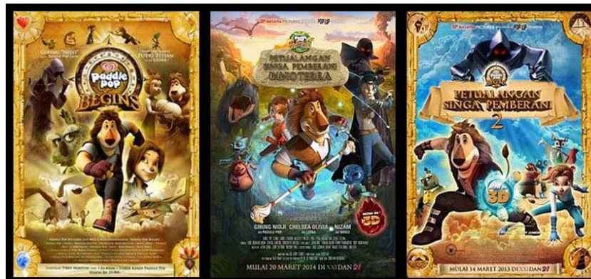
Gambar 8 Poster Promosi Film Animasi Paddle Pop Walls

Selain menjadi media edukasi, komik pun hadir sebagai media pendukung promosi produk. Pada umumnya, komik jenis ini menampilkan sebuah cerita satu halaman saja dan biasanya disajikan dalam sebuah majalah. Biasanya, dengan kepentingan promosi sebuah produk, produsen menciptakan seorang tokoh komik yang membawakan produk mereka. Sebut saja salah satunya produsen es krim, Walls, dalam mempromosikan Paddle Pop membuat karakter tokoh animasi berkarakter singa yang selalu berpetualang. Media Promosi ini dilakukan dengan sangat matang. Promosi berawal dari produk makanan yang disampaikan dengan cerita komik hingga menembus pasar layar lebar film animasi di tanah air.