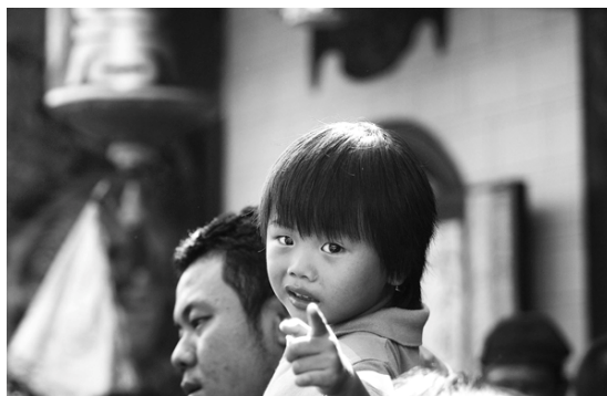
Gambar 11 I want You (F: 2.0, SS: 1/2500, ISO: 200)