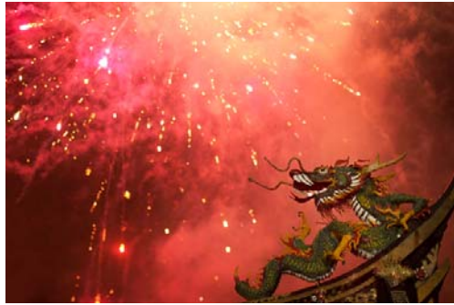
Gambar 17 Api Naga