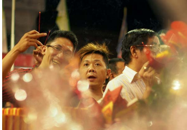
Gambar 9 Mengantre untuk Berdoa (Photography by Hendrie Hartono; F: 1.8, SS: 1/60, ISO: 1600)