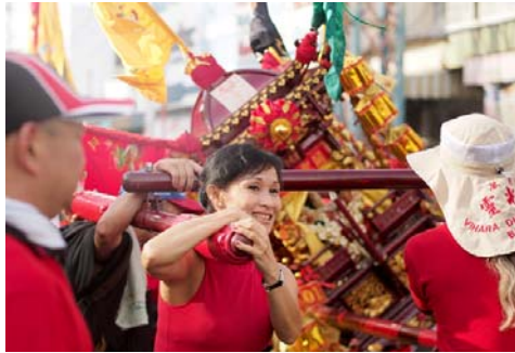
Gambar 13 Walau Berat Tetap Tersenyum (F: 1.8, SS: 1/2000, ISO: 200)