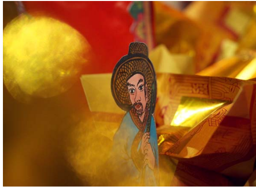
Gambar 1 Uang Kertas dan Ilustrasi Manusia (F: 1.8, SS: 1/100, ISO: 1600)