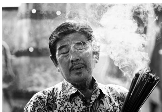
Gambar 3 Praying (F: 1.8, SS: 1/1000, ISO: 200)