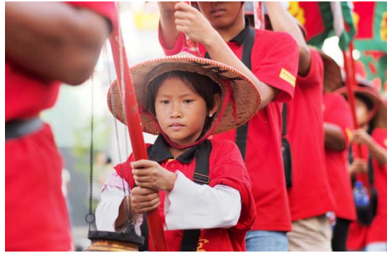
Gambar 15 Paling Muda (Photography by Hendrie Hartono; F: 1.8, SS: 1/640, ISO: 200)