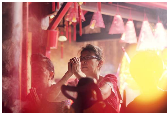
Gambar 6 Praying 2 (F: 1.8, SS: 1/160, ISO: 200)

Bermain komposisi dari foto pengunjung yang sedang berdoa merupakan hal yang menarik. Suasana kelenteng yang cukup ramai dipenuhi pengunjung cukup menyulitkan dalam pengambilan gambar yang diinginkan fotografer. Juga dalam kondisi pencahayaan backlight , fotografer cukup beruntung karena kamera yang digunakan memang terkenal cukup mumpuni dalam memotret backlight dengan detail yang masih terjaga dengan baik, sehingga POI dari foto ini masih tetap terjaga.