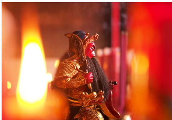
Gambar 7 Kirab Toa Pek Kong (Photography by Hendrie Hartono; F: 1.8, SS: 1/100, ISO: 640)