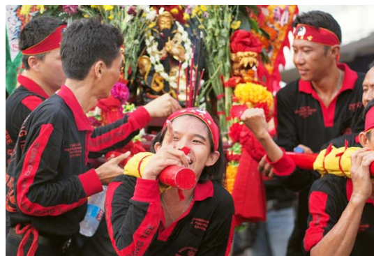
Gambar 16 Ceria dan Kebersamaan (F: 1.8, SS: 1/500, ISO: 200)

Salah satu tamu dari luar kota yang berisi kumpulan remaja memang mempunyai ciri khas yang lain dari orang tua maupun anak-anak. Keceriaan dan ekspresi lepas tampak terlihat sangat natural. Fotografer cukup jeli menangkap ekspresi ini dan mampu menerjemahkan ke dalam sebuah hasil foto yang “berbicara” (Gambar 16). Untuk subjek yang cukup jauh, memang diperlukan lensa yang bertipe tele atau medium tele dengan bukaan lebar untuk mengurangi gangguan latar belakang yang ramai (Sukarya, 2009:109).