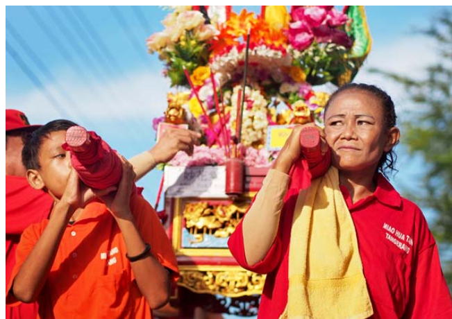
Gambar 14 Ibu dan Anak Memikul Bersama (F: 1.8, SS: 1/4000, ISO: 200)

Ekpresi kebersamaan juga tidak luput dari jepretan fotografer. Banyak macam foto yang bisa didapatkan dari acara ini. Meskipun masih dalam konteks foto dokumentasi, fotografer bisa bereksplorasi dan menangkap sesuatu yang bermacam-macam. Ibu dan anak menjadi ekspresi kebersamaan yang sangat dramatis. Dalam foto, karakter warna yang ditonjolkan adalah warna-warna hangat untuk menambah kesan natural pada sore hari dan kuat. Dalam fotografi warna yang agak kemerahan dikenal dengan warna hangat ( warm ) sedangkan warna yang agak kebiruan dikenal dengan warna dingin ( Cool ). Warna yang tertinggal tersebut sejatinya bisa dinetralkan dengan penggunaan filter atau White Balance .