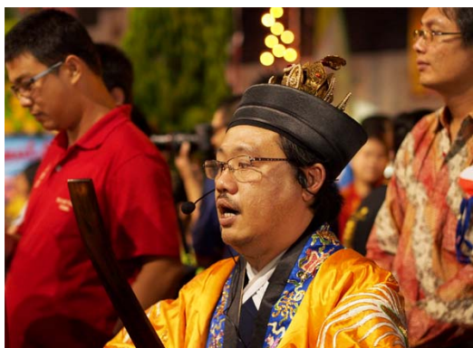
Gambar 8 Doa Malam (F: 1.8, SS: 1/30, ISO: 1600)

Malam hari adalah sebuah tantangan bagi fotografer, apalagi jika fotografer tidak menggunakan bantuan flash sebagai media pembantu pengambilan foto pada malam hari. Penggunaan lensa berbukaan besar memang cukup membantu, tetapi menjadi tidak banyak membantu jika dalam kondisi pencahayaan super low light . Diperlukan pengurangan shutter speed atau angka ISO yang diperbesar meski saat ini teknologi kamera mampu untuk mendapatkan foto yang bermutu walau digunakan pada ISO tinggi (Sukarya, 2009:136). Fotografer memilih tetap di angka ISO 1600 dengan mengurangi shutter speed di angka 1/30, dalam hal ini ketepatan timing pengambilan gambar dengan dibantu oleh fitur 5 axis image stabilization dapat membuat gambar tetap terjaga ketajamannya walaupun dengan penggunaan shutter speed yang cukup rendah.