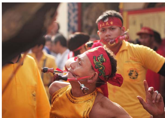
Gambar 12 Tertusuk (Photography by Hendrie Hartono; F: 1.8, SS: 1/4000, ISO: 200)

Foto ini diambil ketika acara arak arakan Toa Pe Kong sudah dimulai (Gambar 12). Perwakilan dari Jakarta pun menyuguhkan atraksi yang mengejutkan. Memotret di tengah keramaian dengan objek yang bergerak dengan dinamis memang membutuhkan kesabaran dan timing yang tepat. Pemilihan angle terkadang memang tidak bisa dipaksakan sesuai dengan yang diinginkan. Momen bisa hilang jika fotografer terlalu banyak berpikir dalam memotret sebuah acara yang bergerak cepat. Cara memotret human interest yang dinamis program otomatis dan autofocus akan membantu untuk mendapatkan foto yang baik dengan lebih pasti (Sukarya, 2009:108).