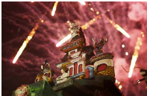
Gambar 18 Serangan Udara (Photography by Hendrie Hartono; F: 1.8, SS: 1/60, ISO: 1600)

Masih dengan foto kembang api, salah satu cara memanipulasi foto kembang api jika tidak memakai teknik Long Exposure adalah mencari salah satu objek yang menarik. Fotografer memilih objek berbentuk rumah di atap kelenteng dan di belakangnya terlihat percikan kembang api yang sedang berlangsung. Dengan angle seperti itu, objek nampak terlihat besar dan megah, berlatar kembang api, menjadikan foto ini menjadi sangat elegan dan fokus pada objek (Gambar 18).