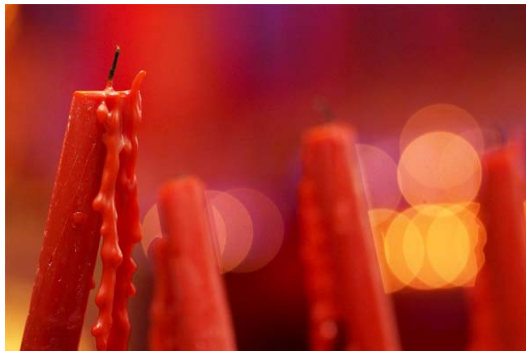
Gambar 2 Lilin tak Berapi (F: 1.8, SS: 1/80, ISO: 1600)

Bermain dengan Deep of Field merupakan sebuah teknik yang saat ini cukup digemari oleh fotografer, terutama jika pada belakang objek utama terdapat lampu atau sumber cahaya yang dapat menghasilkan bokeh yang membentuk bulat (tergantung dari jumlah blade di dalam elemen lensa). Ruang tajam atau biasa disebut dengan Depth of Field dalam fotografi adalah sebuah ruang di depan kamera di mana objek yang berada di dalamnya mempunyai ketajaman yang layak dalam foto yang terekam nantinya (Adi, 2010:7). Objek utama dari foto ini adalah lilin yang digunakan untuk menerangi meja altar persembahan. Foto diambil pada malam hari dan dalam kondisi low light , masih dengan lensa berbukaan besar. Di samping menakar volume cahaya yang masuk melalui lensa, diafragma juga menentukan lingkup ruang tajam (Sukarya, 2009:22).