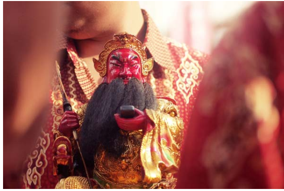
Gambar 5 Membawa Kongco (Photography by Hendrie Hartono; F: 1.8, SS: 1/4000, ISO: 200)