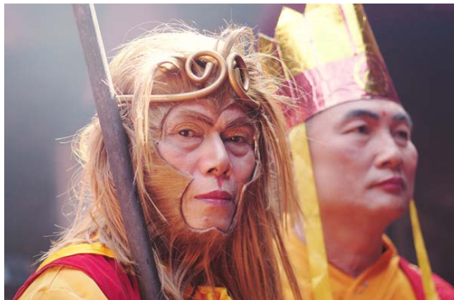
Gambar 10 Journey to the West

Rangkaian acara Sejit Kongco Ceng Gwan Cin Kun juga diramaikan dengan beberapa orang yang melakukan atraksi cosplay . Sesuai dengan lingkungan dan tema tentu saja cosplay yang dipilih adalah cosplay yang berkaitan dengan kebudayaan Tionghoa. Diambil dari Legenda Journey to the West , dengan tokoh utama dari serial ini adalah kera sakti bernama Sun Go Kong dan seorang biksu bijaksana bernama Tong Sam Cong (Gambar 10). Merekam cosplay pada acara ini terasa unik karena para cosplayer yang hanya beberapa orang tentu saja menarik perhatian pengunjung.