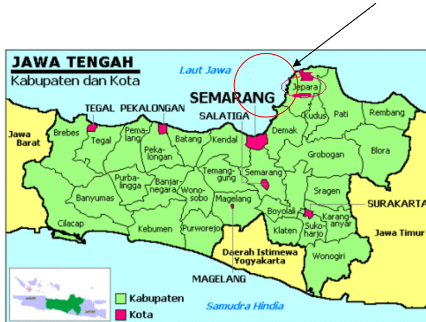
Gambar 1 Peta Geografis Wilayah Jepara