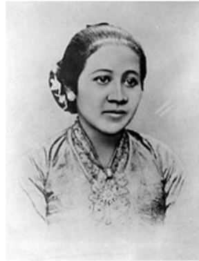
Gambar 3 Repro negatif potret Raden Ajeng Kartini (foto 1890-an)

Dengan adanya sekolah kejuruan ini, kerajinan mebel dan ukiran meluas di kalangan masyarakat. Makin banyak pula anak yang masuk sekolah ini agar mendapatkan kecakapan pada bidang mebel dan ukir. Di sekolah ini diajarkan berbagai macam desain motif ukir serta ragam hias Indonesia yang pada mulanya belum diketahui oleh masyarakat Jepara. Tokoh-tokoh yang berjasa dalam pengembangan motif lewat lembaga pendidikan ini adalah Raden Ngabehi Projo Sukemi, yang mengembangkan motif Majapahit dan Pajajaran, serta Raden Ngabehi Wignjopangukir, yang mengembangkan motif Pajajaran dan Bali.