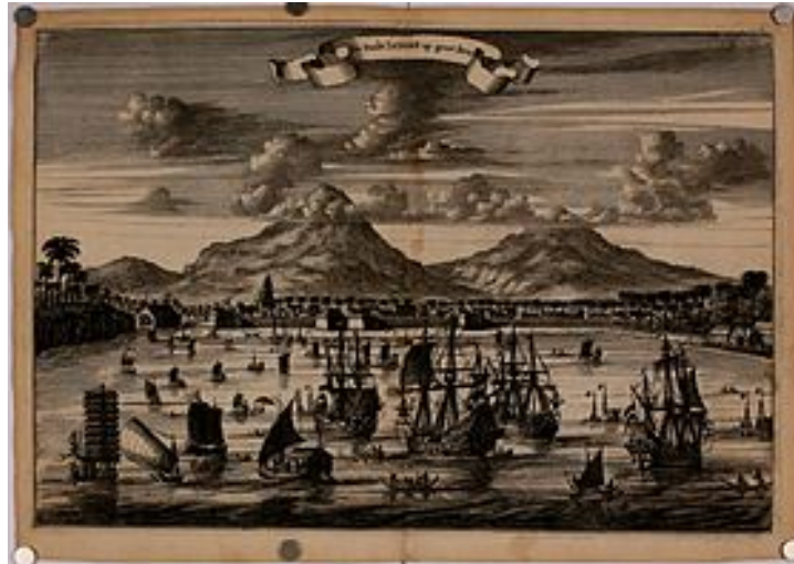
Gambar 2 Pemandangan kota Jepara di sekitar tahun 1650, dengan latar belakang Gunung Muria

Selain bukti sejarah di atas, muncul pula sejarah yang berbentuk mitologi atau legenda. Diceritakan, dahulu kala hiduplah pengukir dan pelukis pada zaman Raja Brawijaya dari Kerajaan Majapahit, Jawa Timur. Pengukir itu bernama Prabangkara atau disebut juga dengan Joko Sungging. Raja Brawijaya ingin mempunyai lukisan istrinya dalam keadaan tanpa busana. Ini wujud rasa cinta sang raja. Dipanggillah ahli ukir dan lukis itu untuk mewujudkan keinginan Raja. Prabangkara mendapatkan tugas yang mustahil: melukis istri raja tanpa busana, tetapi tidak boleh melihat permaisuri dalam keadaan tanpa busana. Ia harus melukisnya melalui imajinasi saja. Prabangkara melaksanakan tugas tersebut, dan tugasnya selesai dengan sempurna. Tiba-tiba, seekor cecak mengeluarkan kotoran dan mengenai lukisan, sehingga lukisan permaisuri tersebut mempunyai tahi lalat. Raja gembira dengan hasil karya Prabangkara tersebut. Dilihatnya dengan detail gambar lukisan tersebut. Begitu dia melihat tahi lalat, raja murka. Dia menuduh Prabangkara melihat permaisuri tanpa busana karena lokasi tahi lalat persis dengan kenyataan. Raja cemburu dan menghukum Prabangkara dengan mengikatnya di layang-layang, kemudian menerbangkannya. Layang-layang itu terbang hingga ke Belakang Gunung di Jepara dan mendarat di Belakang Gunung itu. Belakang Gunung itu kini bernama Mulyoharjo di Jepara. Kemudian, Prabangkara mengajarkan ilmu ukir kepada warga Jepara. Kemahiran ukir warga Jepara bertahan dan lestari hingga sekarang.