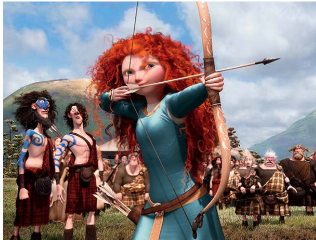
Gambar 2 Contoh gerakan antisipasi dalam film Brave 2012

refleks. Seperti tangan manusia yang hendak ingin memanah seperti gambar diatas, tangan kita akan menarik benda yang akan ditarik oleh karet kearah belakang adalah gerakan antisipasi sebelum penembakan, antisipasi ini sangat menentukan kecepatan pada tembakan, jika antisipasi tarikan panah lebih ditarik kebelakang maka panah akan menembak lebih kencang dari pada hanya ditarik sedikit. Lihat gambar 2.