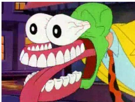
Gambar 4 Contoh gerakan melebih-lebihkan dalam film The Mask

Gerakan melebih-lebihkan ( exaggeration ) biasanya terdapat pada animasi cartoony . Wajah, ekspresi, pose, sikap dan tindakan seperti yang ada di referensi dibuat gerakan yang lebih ekstrem. Gerakan yang tidak akurat ini bisa menarik perhatian para penonton agar lebih menarik.