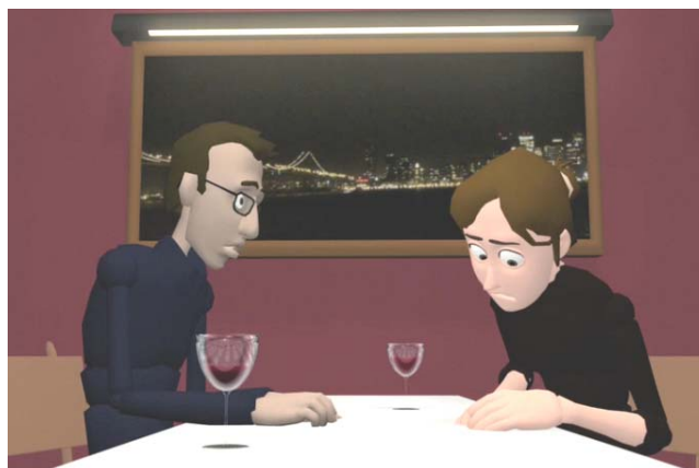
Gambar 6 Karakter perempuan tidak menatap mata lawan bicara

Dalam memilih key pose harus memiliki garis aksi yang kuat. Garis Aksi dalam karakter adalah salah satu aspek yang paling penting dari berpose. Seperti contoh di atas, menggambarkan tindakan fisik penting yang emosional dalam suatu adegan. Jika salah satu key pose terhapus, gerakan akan menjadi cacat atau tidak sempurna. Penentuan gerakan key pose dengan garis aksi yang tidak kuat juga akan membuat animasi kurang sempurna. Untuk itu, animator harus sangat berhati-hati dalam menentukan gerakan key pose ini untuk menyempurnakan sebuah adegan animasi.