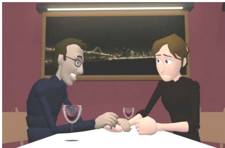
Gambar 7 Karakter perempuan menatap mata lawan bicara

Pandangan mata pada karakter merupakan hal yang penting dalam suatu adegan. Sebagai animator harus mengetahui ke arah manakah karakter akan melihat, apa yang sedang dilihat. Sebagai contoh, ada dua karakter yang sedang melakukan percakapan. Jika karakter itu merasa tidak nyaman, sedang berpikir, tegang, malu atau berbohong, karakter tersebut tidak akan melihat lawan mainnya dengan tatapan mata. Begitu juga sebaliknya jika kedua karakter sedang melakukan percakapan yang serius atau melakukan aksi terkejut, mereka akan saling melihat satu sama lain.