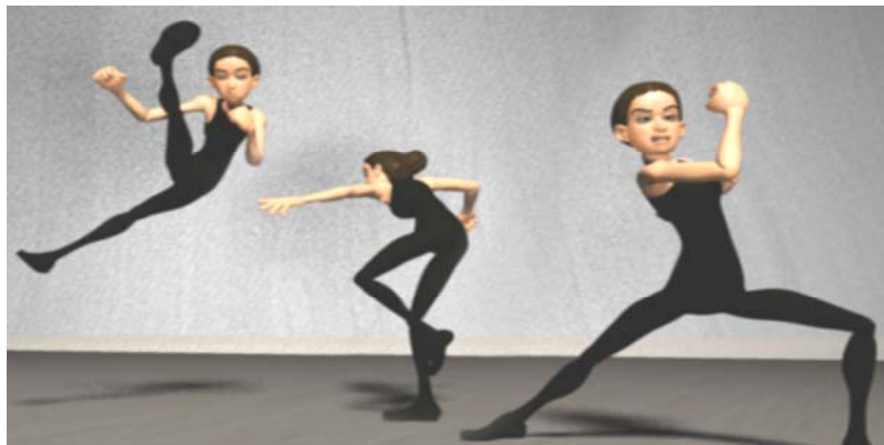
Gambar 5 Contoh key pose gerakan tubuh

Hal yang paling penting adalah mengomunikasikan pose aksi pada karakter. Pemilihan pose harus berdasarkan apa yang ingin disampaikan animator kepada penonton. Pose tubuh disesuaikan dengan ekspresi muka sehingga lebih mudah bagi penonton untuk mengerti jalan cerita dalam animasi tersebut. Memang tidak ada peraturan untuk menyimpan emosi karakter, tetapi sebaiknya karakter bisa menonjolkan emosi, niat, dan meningkatkan daya tarik. Lihat gambar 5 berikut untuk contoh key pose .