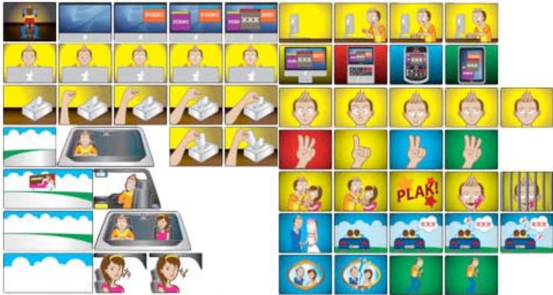
Gambar 4 Vektorisasi Bahan Animasi Film Pendek Anti Pornografi (Darmawan, 2010)

Hasil animasi ini dapat dilihat pada Youtube dengan melakukan pencarian "Anti Pornografi" pada situs broadcast online www.youtube.com yang dipilih penulis sebagai media publikasi utama kampanye. Dasar pemilihan media ini adalah penggunaan yang tidak dikenakan biaya, laporan statistik yang lengkap, dan popularitas situs dalam kategori media audio visual online . Diharapkan melalui situs ini, media utama kampanye dapat tersebar luas dan cepat.