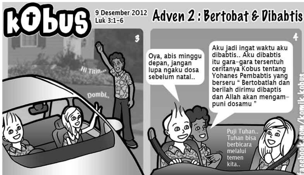
Gambar 2 Contoh Komik Mingguan Kobus (Darmawan, 2010)

Selain logo, penulis juga menemukan bahwa beberapa tokoh fiktif perlu menjadi komunikator kampanye ini, hal ini seiring pula dengan kegiatan penulis yang aktif mengisi rubrik komik mingguan bernama Kobus, di mana telah tercipta beberapa karakter yang dapat mendukung kampanye ini. Dari beberapa karakter yang ada, penulis memilih tiga karakter pula yang akan bermain pada media utama kampanye Anti Pornografi ini, yaitu Kobus sebagai pemeran utama, Titin sebagai pacar Kobus, dan Dombi sebagai sahabat baik Kobus.