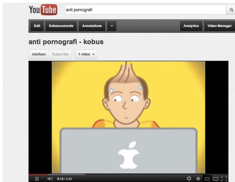
Gambar 5 Animasi Film Pendek Anti Pornografi Pada Youtube (Darmawan, 2010)

Hasil animasi ini dapat dilihat pada Youtube dengan melakukan pencarian "Anti Pornografi" pada situs broadcast online www.youtube.com yang dipilih penulis sebagai media publikasi utama kampanye. Dasar pemilihan media ini adalah penggunaan yang tidak dikenakan biaya, laporan statistik yang lengkap, dan popularitas situs dalam kategori media audio visual online . Diharapkan melalui situs ini, media utama kampanye dapat tersebar luas dan cepat.