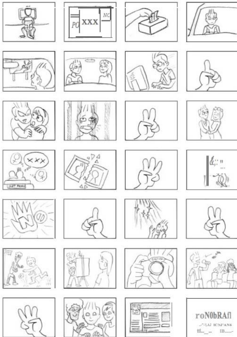
Gambar 3 Sketsa Animasi Film Pendek Anti Pornografi (Darmawan, 2010)

Setelah proses sketsa, penulis melanjutkan proses yang selanjutnya yaitu masuk dalam pembuatan visual menggunakan sistem ilustrasi komputer berbasis vektor grafik. Menurut Darmawan (2010) sistem ini menjadi sebuah gaya visual yang modern, dengan visualisasi fill and outline , dan ditambah gradasi sederhana untuk pembentukan volume visual.