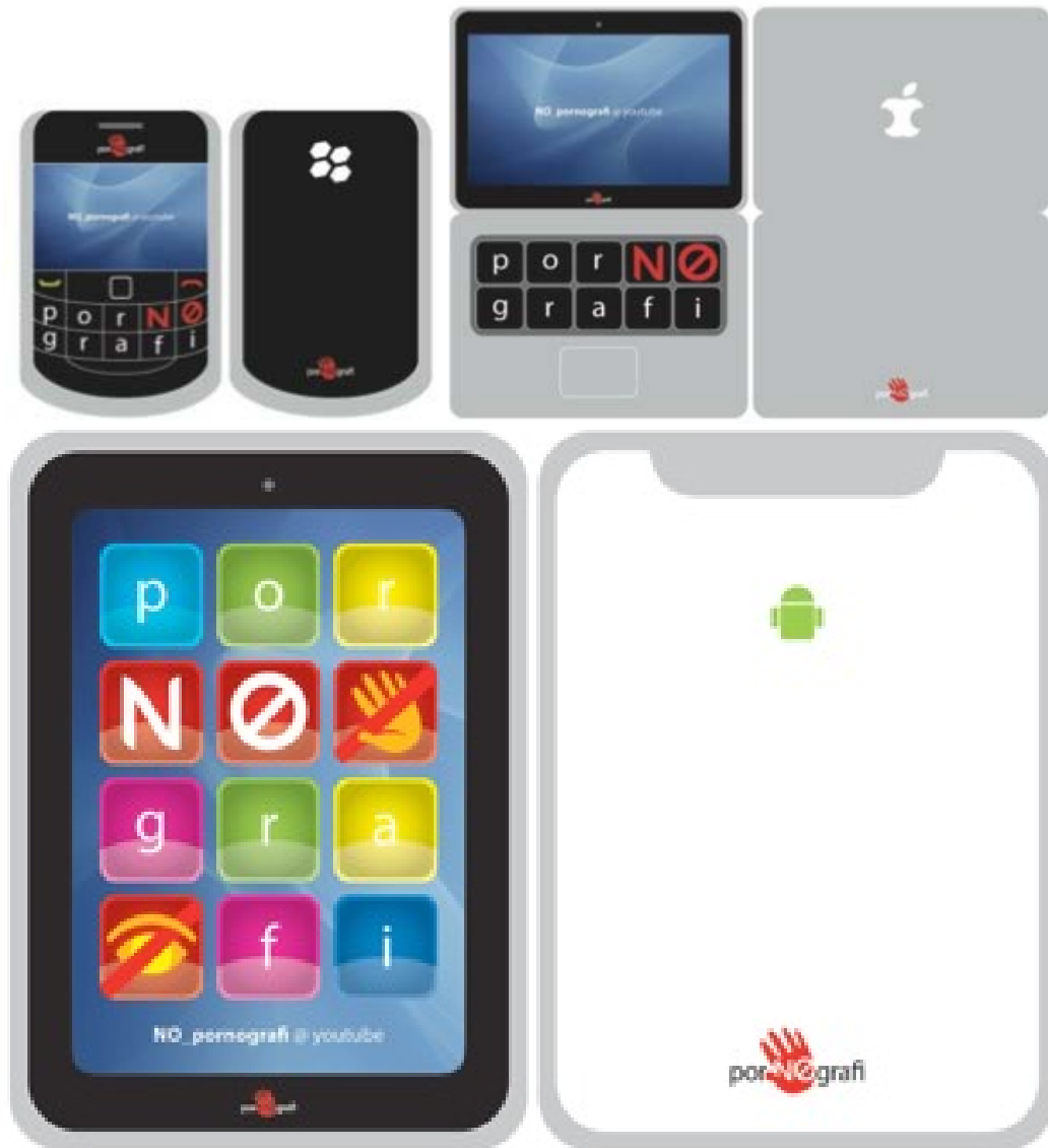
Gambar 6 Teaser Kampanye Anti Pornografi (Darmawan, 2010)

Selanjutnya untuk teaser , sengaja dilakukan pendekatan ambience . Visual juga sengaja dibuat berupa visualisasi media-media elektronik seperti handphone Blackberry, pad dari Android, dan laptop dari Apple. Hal ini dilakukan dengan pertimbangan kedekatan benda-benda elektronik tersebut dengan target audience . Diharapkan teaser dapat memancing rasa ingin tahu dan diarahkan untuk melihat audio visual sebagai media utama penyampaian pesan secara online .