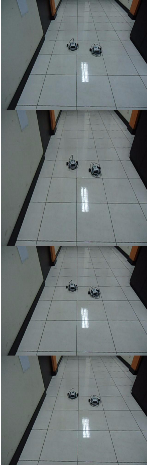
Gambar 9. Pergerakan Dua Robot NXT Mindstorms Formasi Berdampingan

Pergerakan robot dirancang memiliki pergerakan dasar, yaitu: pergerakan lurus, pergerakan belok ke kanan 30 derajat dan pergerakan belok ke kiri juga 30 derajat. Dari Gambar 8 dan Gambar 9 dapat dilihat bahwa secara umum kedua robot mampu melakukan pergerakan dasar, baik pergerakan lurus, belok ke kanan maupun belok ke kiri. Selain itu dapat dikatakan bahwa telah terjadi pula hubungan komunikasi yang baik antara robot leader dengan robot follower, dimana robot follower dapat bergerak sesuai dengan perintah yang diberikan oleh robot leader melalui teknologi Bluetooth.