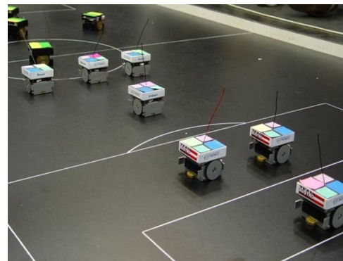
Gambar 2. Implementasi Sistem Multi-Robot berbasis Organizational and Social Paradigm

Organizational and social paradigm didasari oleh teori organisasi yang diturunkan dari sistem manusia. Pengetahuan dari berbagai bidang kemanusiaan, seperti sosiologi, ekonomi atau psikologi telah terbukti mampu untuk memahami bagaimana menciptakan sistem yang dapat bekerjasama untuk menyelesaikan problematika yang kompleks. Pada pendekatan ini, interaksi robot dirancang menggunakan model individual dan dinamika grup sebagai bagian dari organisasi sehingga dapat mengurangi kebutuhan komunikasi antara robot. Aplikasi umum dari pendekatan ini adalah robo-soccer , yaitu pembagian tugas masing-masing robot sesuai dengan fungsinya, seperti sebuah organisasi.