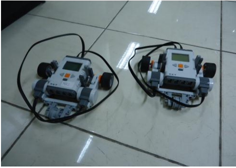
Gambar 6. Robot NXT Mindstorms Hasil Perancangan

Pengujian dilakukan dengan membuat formasi bagi dua buah robot NXT Mindstorms. Kedua robot tersebut berkomunikasi dengan menggunakan teknologi Bluetooth. Sebelum terjadi komunikasi, harus dipastikan terlebih dahulu, bahwa peralatan teknologi Bluetooth keduanya telah terpasang dan terhubung secara pair .