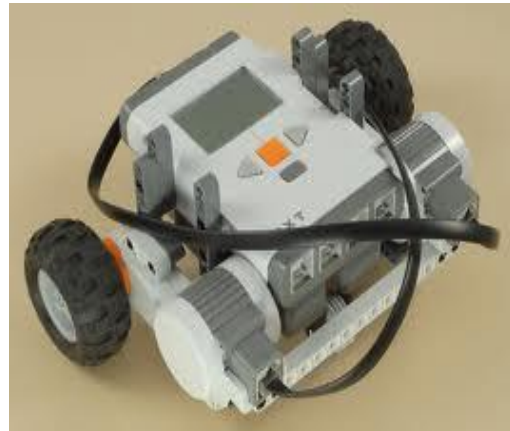
Gambar 5. Robot dari NXT Mindstorms