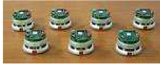
Gambar 1. Implementasi Sistem Multi-Robot berbasis Bioinspired Paradigm

Bioinspired paradigm adalah cara memandang sistem multi-robot seperti kumpulan binatang-binatang kecil yang berinteraksi secara kolektif. Pada paradigma ini, kebutuhan tiap robot untuk berkomunikasi sangat rendah, dengan asumsi bahwa mereka memiliki kemampuan untuk mengetahui keadaan sekelilingnya dengan baik. Dari asumsi ini menyimpulkan bahwa aplikasi yang dibutuhkannya cukup sederhana, aturan pengendalian yang serupa untuk setiap robot, tidak membutuhkan interaksi yang kompleks dan masing-masing mampu untuk saling dipertukarkan. Paradigma ini sesuai untuk aplikasi multi-robot yang mengutamakan ruangan yang tersebar, seperti proses pencarian, pembentukan formasi dan pencakupan area.