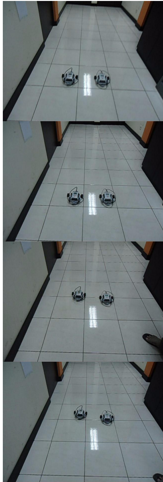
Gambar 8. Pergerakan Dua Robot NXT Mindstorms Formasi Berurutan