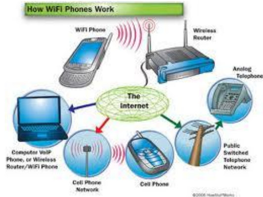
Gambar 4. Aplikasi Bluetooth

Beberapa aplikasi Bluetooth diperlihatkan pada Gambar 4.