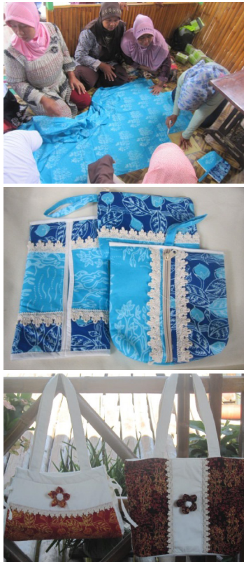
Gambar 7. Pelatihan diversifikasi batik mangrove beserta produk yang dihasilkan

Sebagai tindak lanjut dari kegiatan pelatihan diversifikasi batik mangrove tingkat selanjutnya, yaitu membuat tas sederhana untuk bepergian. Tas yang dibuat merupakan hasil modifikasi dari kain blaco putih yang divariasikan dengan batik mangrove yang mempunyai warna terang. Adanya pelatihan tas tersebut, menambah ketrampilan mitra binaan (Kelompok Merah Delima) dalam menghasilkan berbagai jenis produk berbahan batik mangrove. Diharapkan dengan pelatihan tersebut akan menambah penghasilan ibu-ibu mitra binaan untuk menambah penghasilan keluarga.