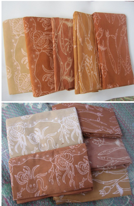
Gambar 4. Batik mangrove hasil pelatihan mitra binaan

mulai proses pengecapan, pencelupan, lorotan, hingga menjadi kain batik yang siap jual.