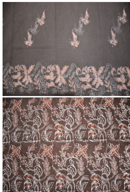
Gambar 6. Motiv batik mangrove yang dihasilkan dan diproduksi oleh mitra binaan.

Disamping pelatihan membuat pewarna alami dan batik mangrove, mitra binaan juga diberi keterampilan tentang membuat diversifikasi produk batik. Adanya tambahan keterampilan membuat berbagai dompet dan tempat tissue tersebut dapat menjadikan alternative bagi anggota kelompok dalam menghasilkan produk-produk batik yang dihasilkan.