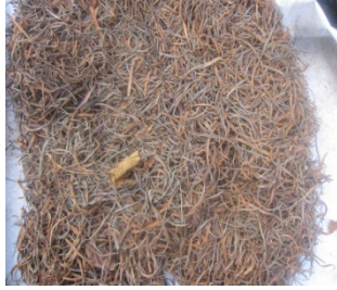
Gambar 2. Pewarna alami dan motif batik berbahan baku mangrove

(2) Aspek motif dan corak batik yang dihasilkan. Dalam kegiatan ini dikembangkan motif dan corak batik mangrove. Adanya variasi motif dan corak dengan latar belakang ekosistem mangrove diharapkan akan lebih mengenalkan ekosistem mangrove yang banyak terdapat di wilayah pesisir. Motif dan corak berlatar belakang mangrove dapat berasal dari pewarna alami limbah mangrove. Motif dan corak batik ini juga dapat mengenalkan flora maupun fauna ekosistem mangrove yang terdiri dari ikan, kepiting, burung dan berbagai jenis tumbuhan yang ada di ekosistem mangrove. Adanya pemberian pelatihan motif batik mangrove yang mempunyai nilai jual tinggi, diharapkan dapat menambah variasi dan motif batik dari mitra binaan yang harapannya akan menambah nilai jual batik yang sudah dihasilkan.