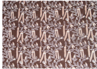
Gambar 3. Buah mangrove dan motif batik mangrove

(3) Diversifikasi produk batik mangrove. Untuk meningkatkan nilai jula dari batik mangrove yang dihasilkan, Mitra Binaan “Merah Delima” diberi pelatihan membuat diversifikasi produk batik. Produk yang akan dilatihkan berupa bros, dompet dan tas berbahan baku batik mangrove. Dengan adanya diversifikasi produk tersebut akan menambah koleksi produk mitra binaan. Dengan adanya souvenir dengan motif dan pewarna alami dari mangrove ini dapat menjadikan buah tangankhas Semarang. Dengan demikian wisatawan bisa mendapatkan kenang-kenangan khas mangrove Semarang.