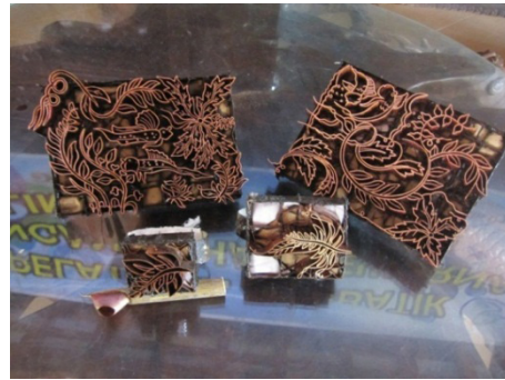
Gambar 5. Alat cetak batik mangrove dari hasil desain tim pengabdian

Pengrajin “Batik Zie”, merupakan salah satu produsen batik yang cukup dikenal di Kota Semarang. Disamping menghasilkan batik corak “Semarangan”, Batik Zie juga memproduksi batik mangrove. Untuk lebih menambah variasi corak batik mangrove mitra binaan, tim pengabdian telah membuatkan 4 (empat) desain batik mangrove dengan corak mangrove dari jenis Avicennia marina serta ekosistem mangrove. Adanya tambahan jenis corak batik tersebut, akan menambah koleksi serta pilihan bagi konsumen yang berkunjung ke Batik Zie.