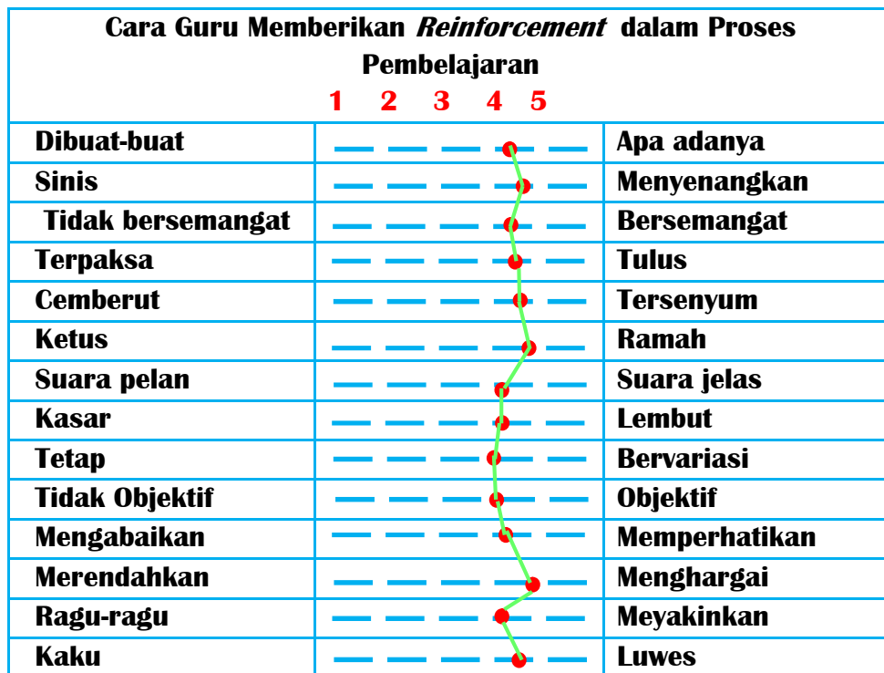
Grafik 3. Cara guru memberikan reinforcement

skor rata-rata cara guru memberikan reinforcement akan disajikan dalam bentuk grafik berikut: