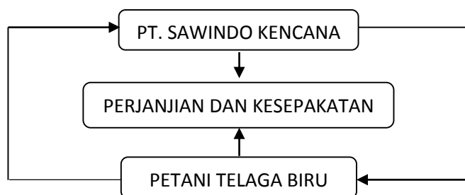
Gambar 1. Mekanisme Kemitraan antara PT. Sawindo Kencana dan Petani Telaga Biru.

Kemitraan yang dijalankan meliputi saprodi yang berarti sarana produksi yang disediakan oleh perusahaan. Hal tersebut dilakukan mulai dari proses yang pertama yaitu produksi dimana segala pupuk, bibit telah disediakan oleh perusahaan yang akan diberikan kepada kelompok tani. Kedua yaitu pemasaran, dimana hasil panen dari petani akan dikelola oleh perusahaan, sehingga petani tidak perlu repot dan sulit dalam menjual hasil panen. Berikut ini merupakan bagan yang menjelaskan tentang mekanisme kemitraan antara PT. Sawindo dan Petani Telaga Biru.