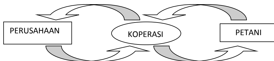
Gambar 3. Bagan Sistem dan Cara Pembayaran dalam Pola Kemitraan antara Kelompok Tani Telaga Biru dengan PT. Sawindo Kencana

Berdasarkan bagan tersebut, dijelaskan bahwa petani menyerahkan hasil panen kepada koperasi dan dilanjutkan ke perusahaan. Hasil penjualan panen yang diterima petani berasal dari perusahaan dan perusahaan menyerahkan kepada koperasi untuk mengelolah dan memberikan hasil tersebut kepada petani.