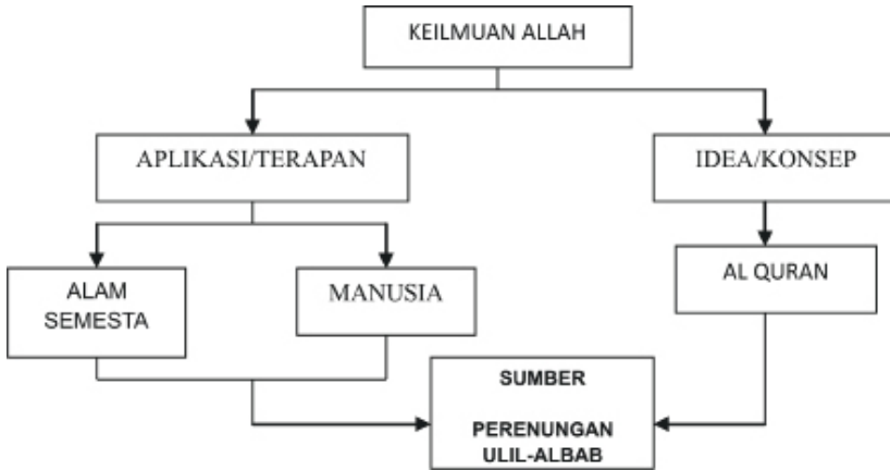
Gambar 2. Diagram kerangka dasar paradigma keilmuan intelektual Muslim

Eropa untuk mengebiri peran dan eksistensi gereja.